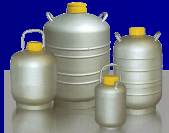
Дьюар - сосуды