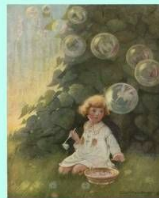
Ф.Т. Хантера. Фей мыльных пузырей. 1921 год.