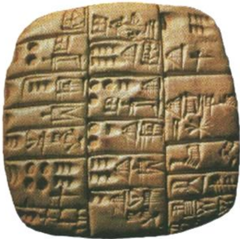
Шумерская глиняная табличка.

В Древнем Шумере папируса практически не было. Поэтому для письма применяли глину. Глиняные таблички размером 25-30 см, чуть-чуть подсушивали на солнце и наносили на них клинописные знаки. Затем табличку или обжигали, или досушивали. Полученные «книги» хранили в библиотеках.