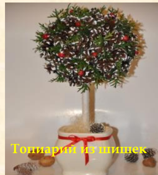
Топиарий из шишек