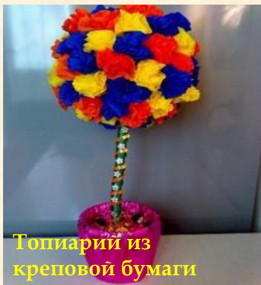
Топиарий из креповой бумаги