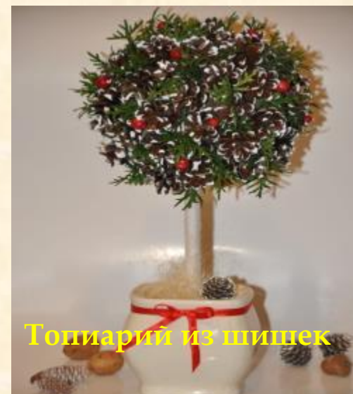
Топиарий из шишек