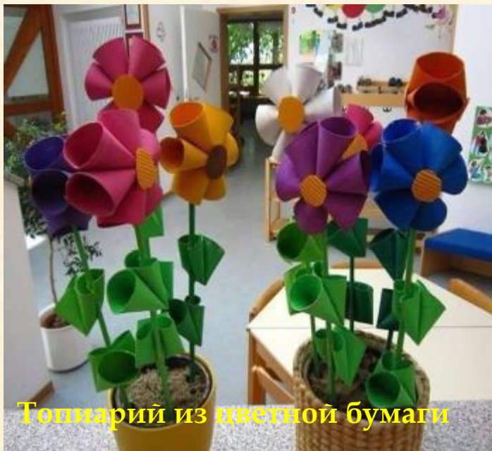
Топиарий из цветной бумаги