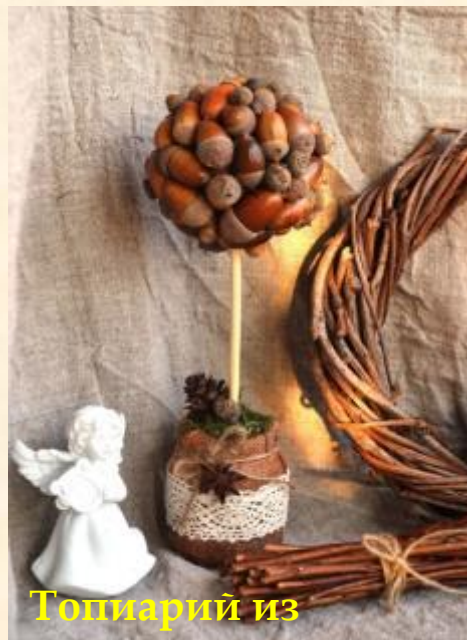
Топиарий из желудей