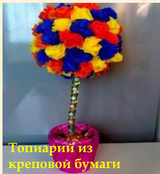
Топиарий из креповой бумаги