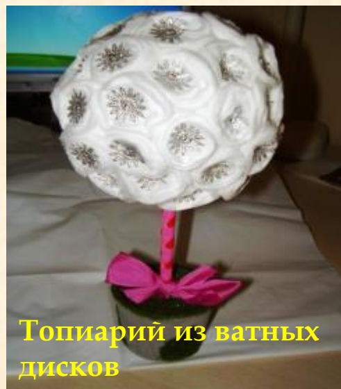
Топиарий из ватных дисков