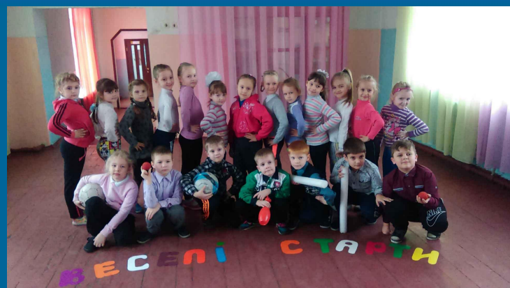
Фізична культура. Урок – змагання