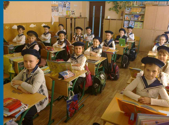
Математика. Урок - подорож