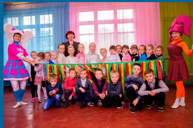
Природознавство. Урок – сюрприз