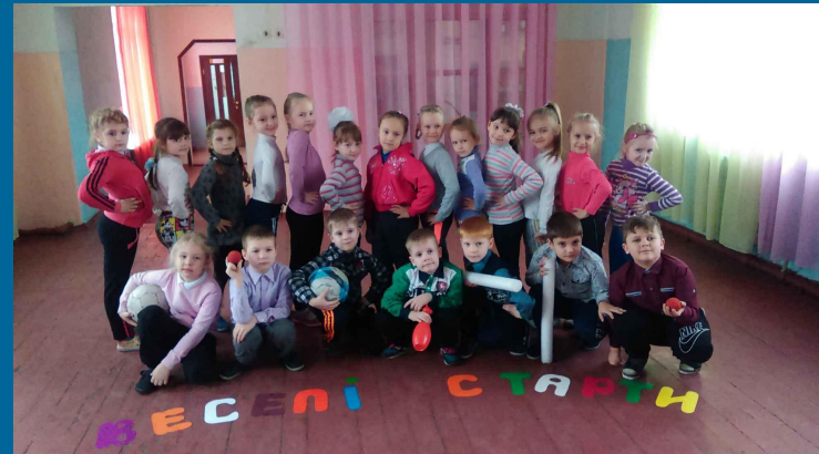
Фізична культура. Урок – змагання