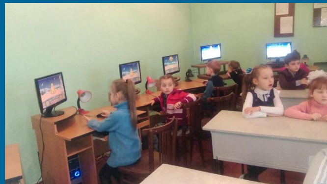
Математика. Урок з використанням ІКТ