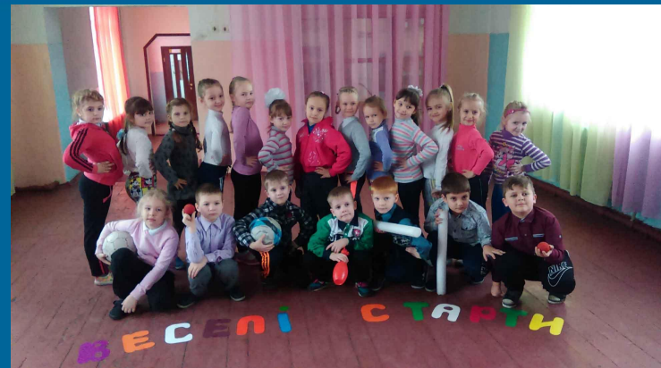
Фізична культура. Урок – змагання