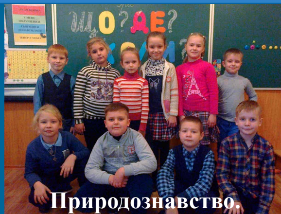
Природознавство. Урок – гра «Що? Де? Коли?»