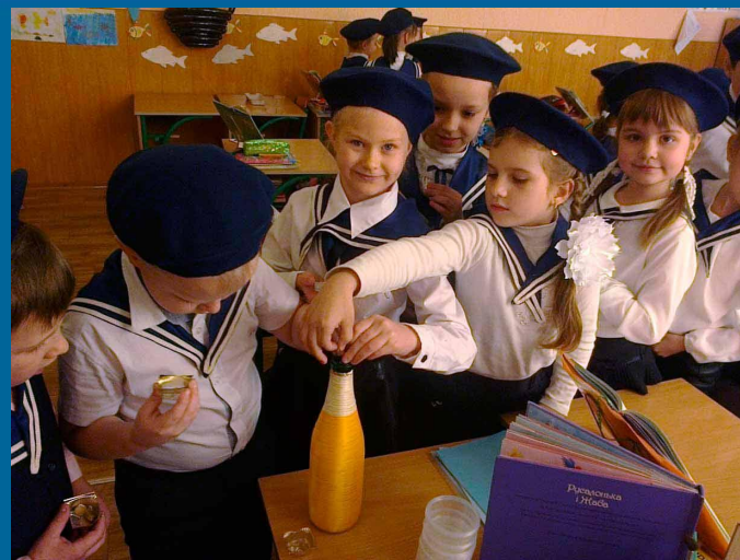
Математика. Інтегрований урок