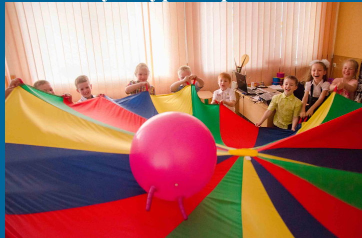
Основи здоров'я. «Фізичний орієнтир»