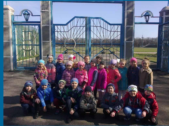
Природознавство. Урок екскурсія