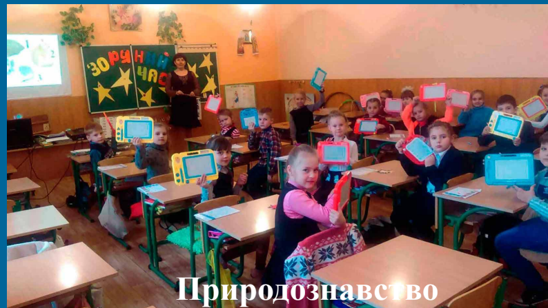
Природознавство Урок – гра «Зоряна година»