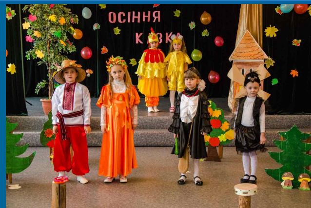
Навчання грамоти. Урок казка