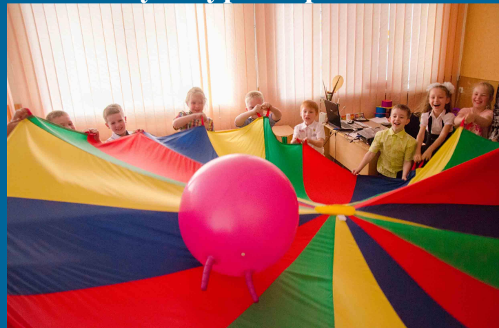
Основи здоров'я. «Фізичний орієнтир»