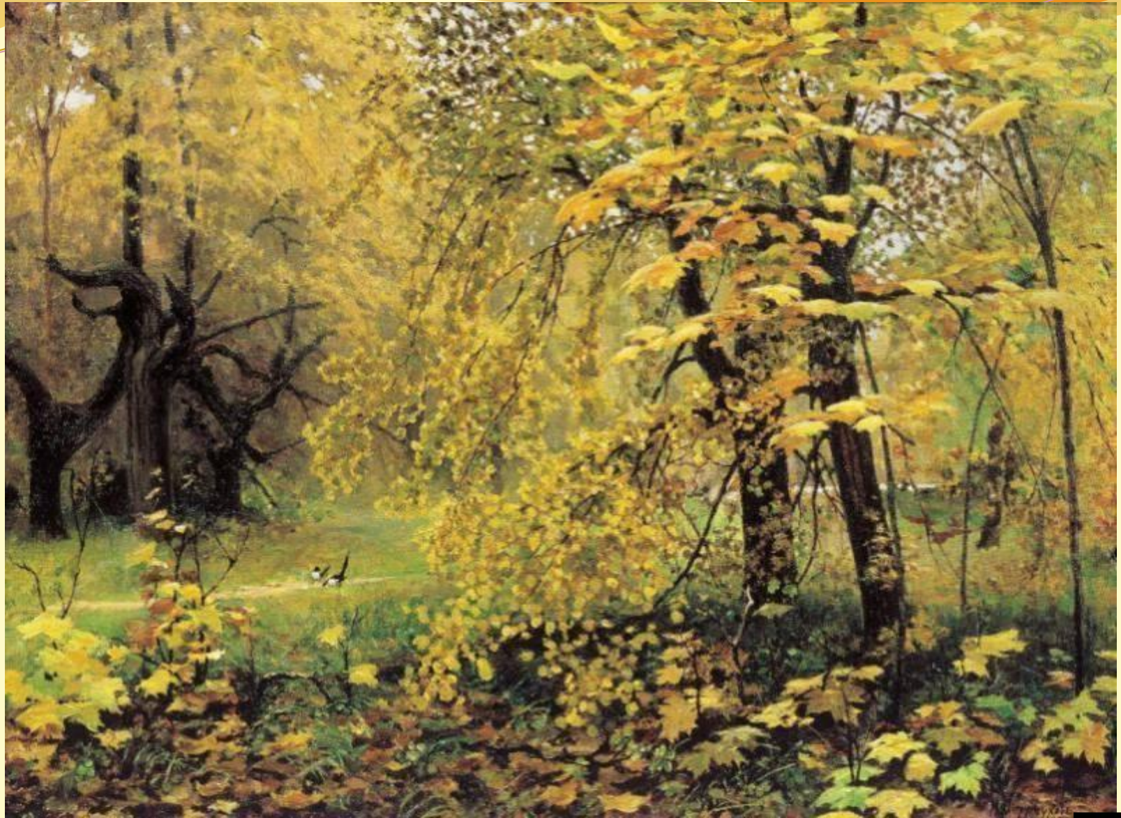
И. С. Остроухов «Золотая осень»