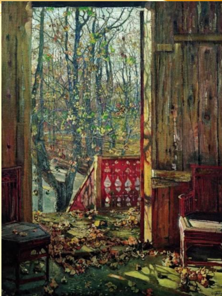
И. И. Бродский «Опавшие листья»