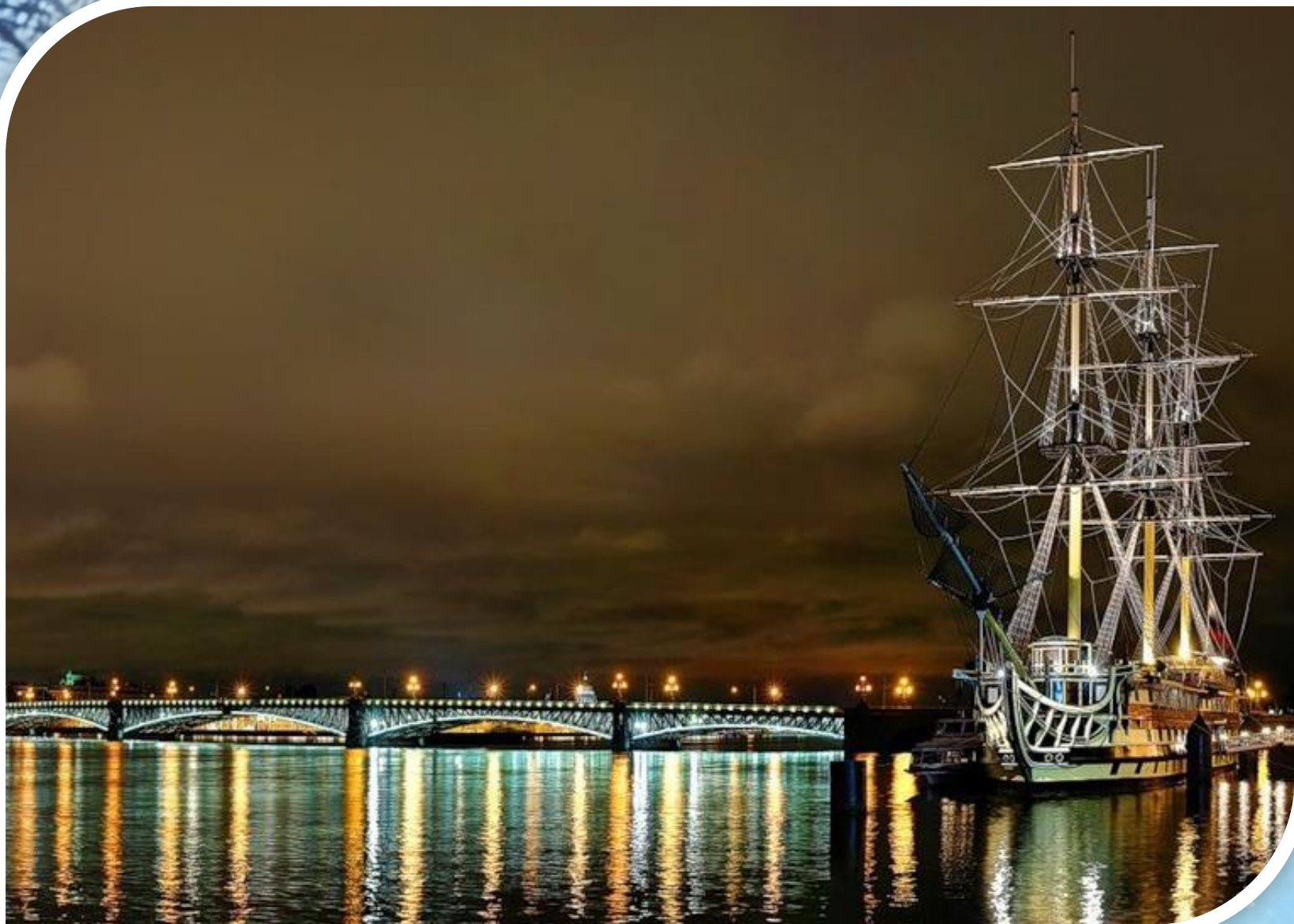
Вид на Троицкий мост с Петровской набережной.