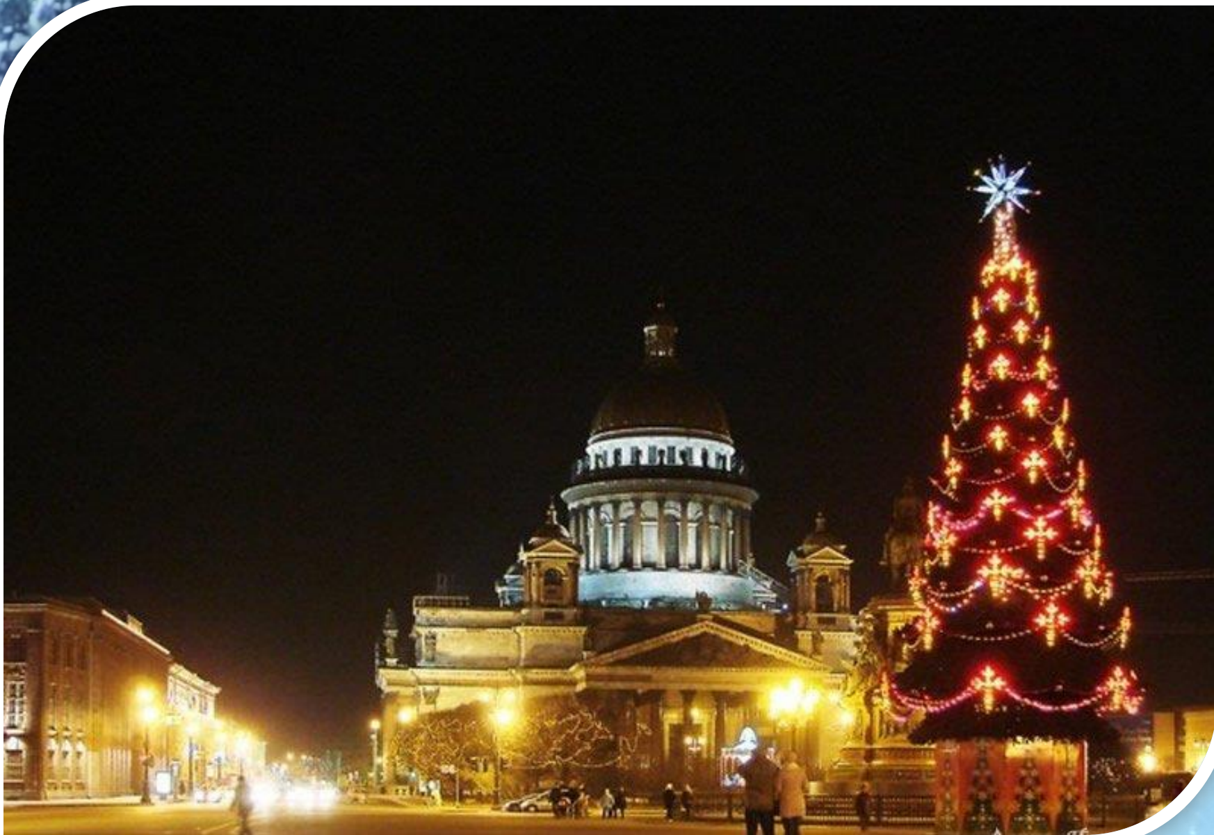
Новогодняя елка на Исаакиевской площади.