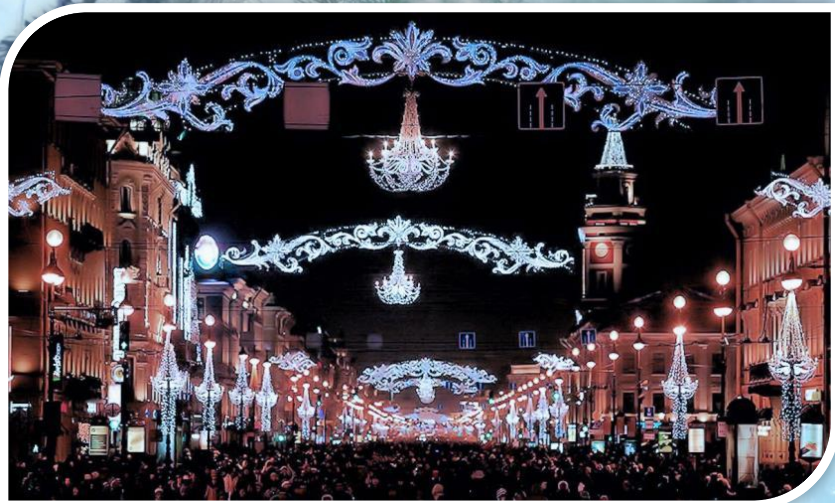
Невский проспект в НОВОГОДНЮЮ НОЧЬ.