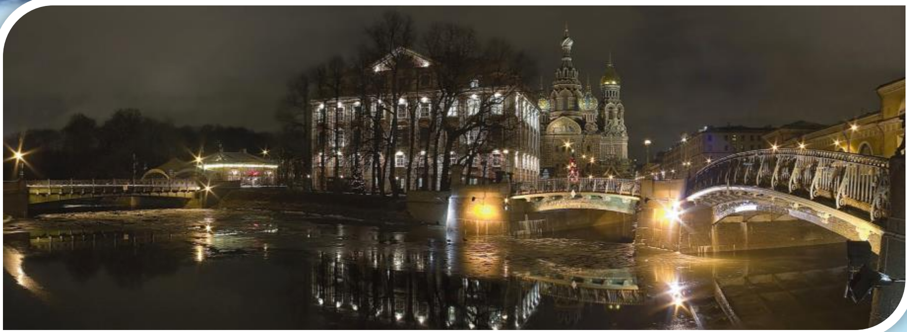
Набережная рек Мойки и канала Грибоедова.