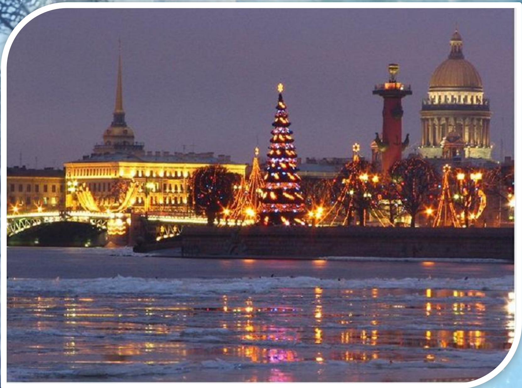
Вид на Стрелку Васильевского острова.