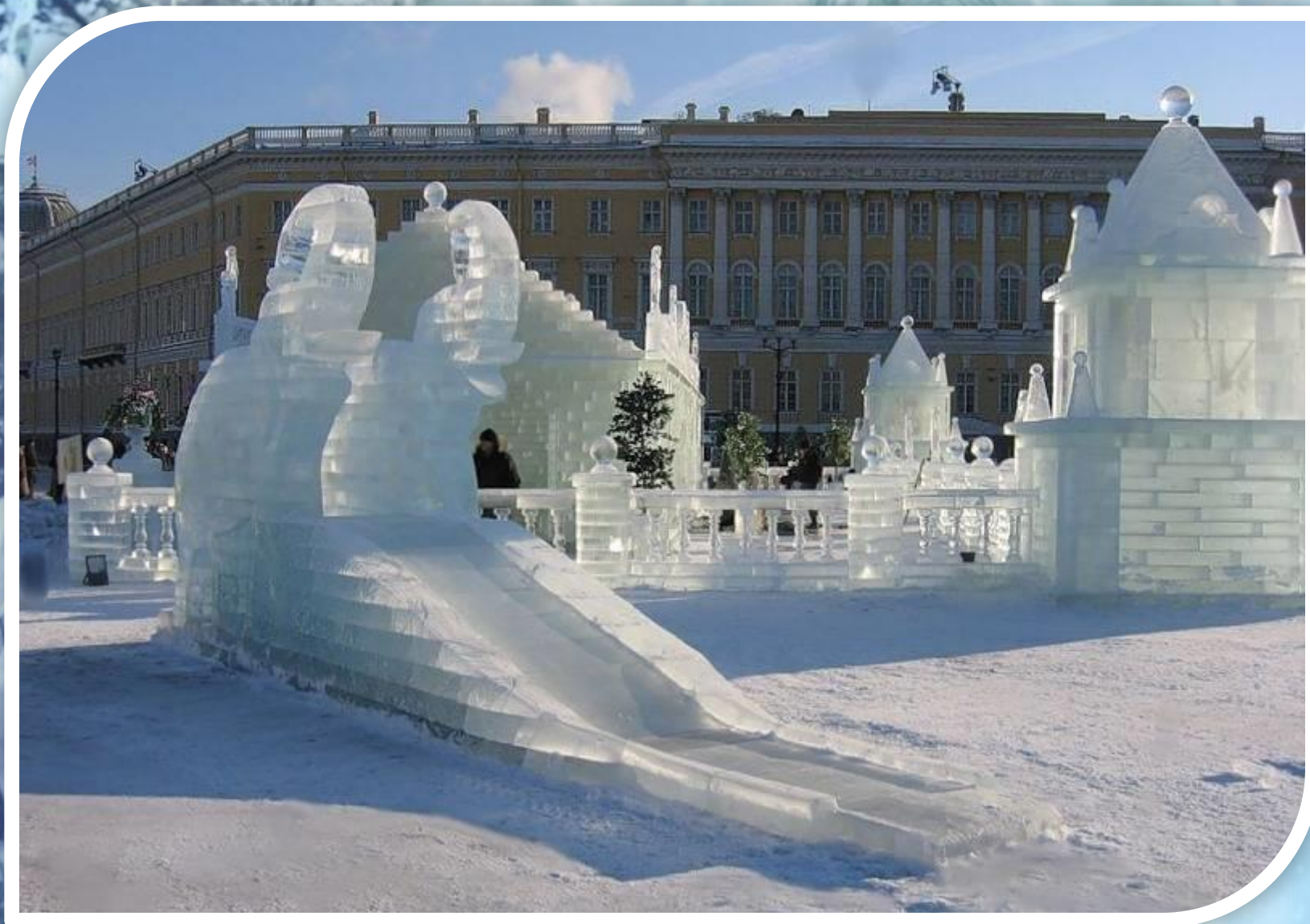
Ледяной городок на Дворцовой площади.