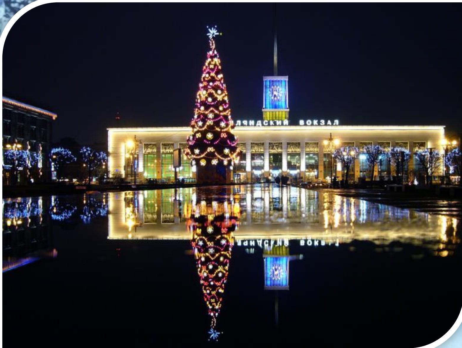
Новогодняя елка на площади Ленина возле Финляндского вокзала.