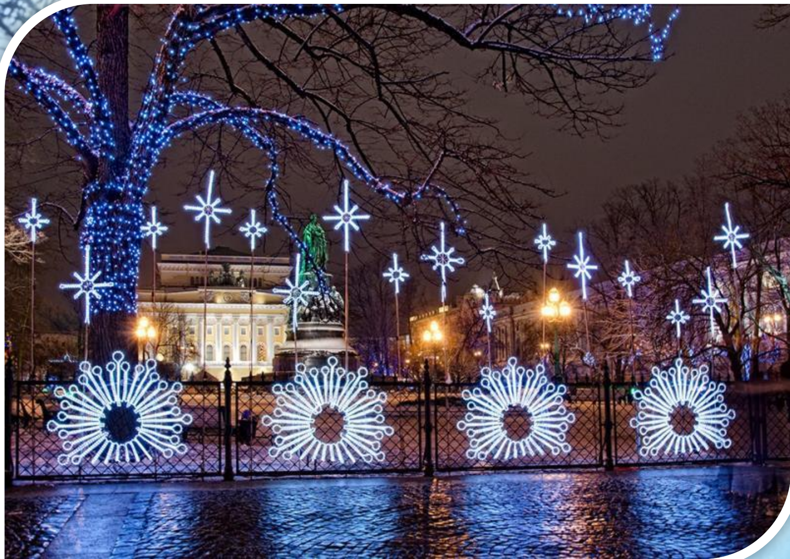
Екатерининский сквер на площади Островского.