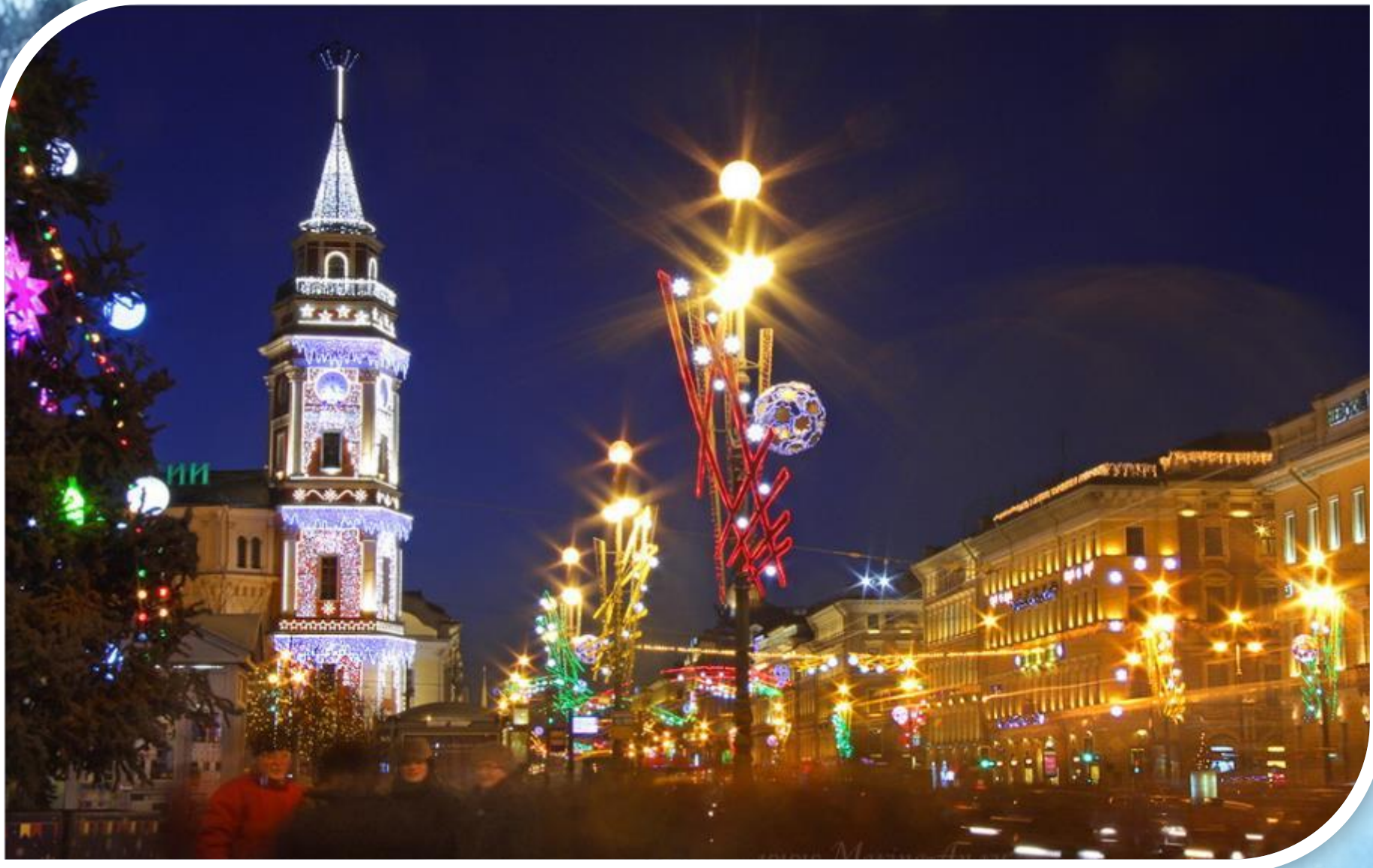
Украшенная башня здания Городской Думы на Невском проспекте