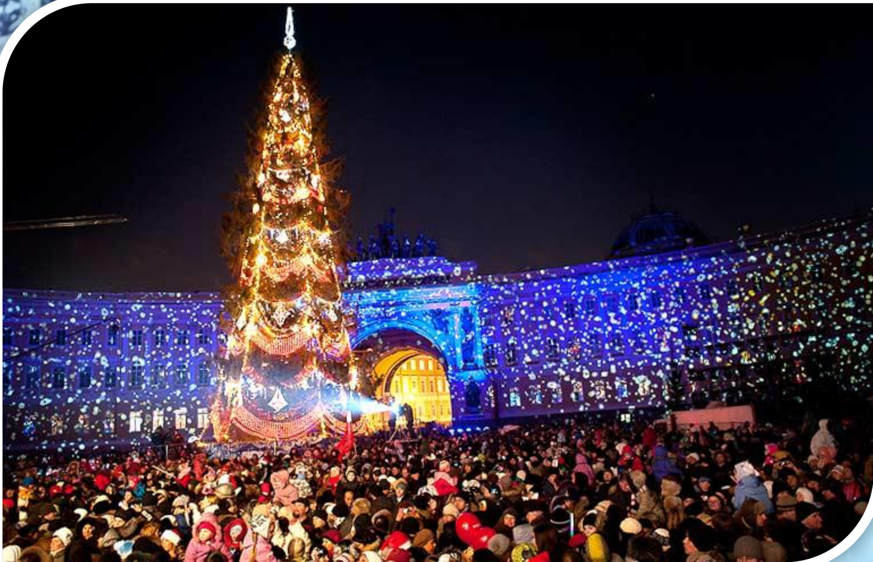
Новогодние гуляния в новогоднюю ночь на Дворцовой площади.