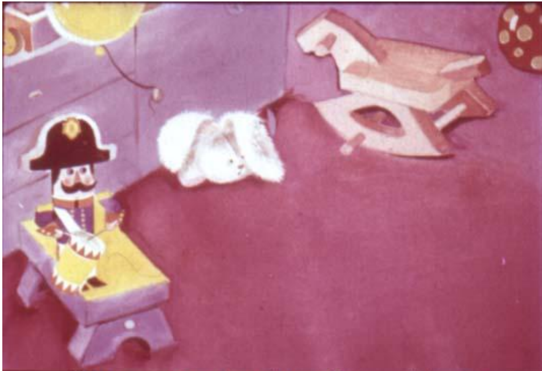
И тут из-под шкафа выбрался Плюшевый Кролик.