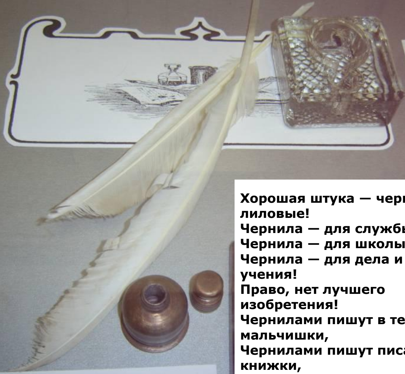
Переносная чернильница и подсвечник