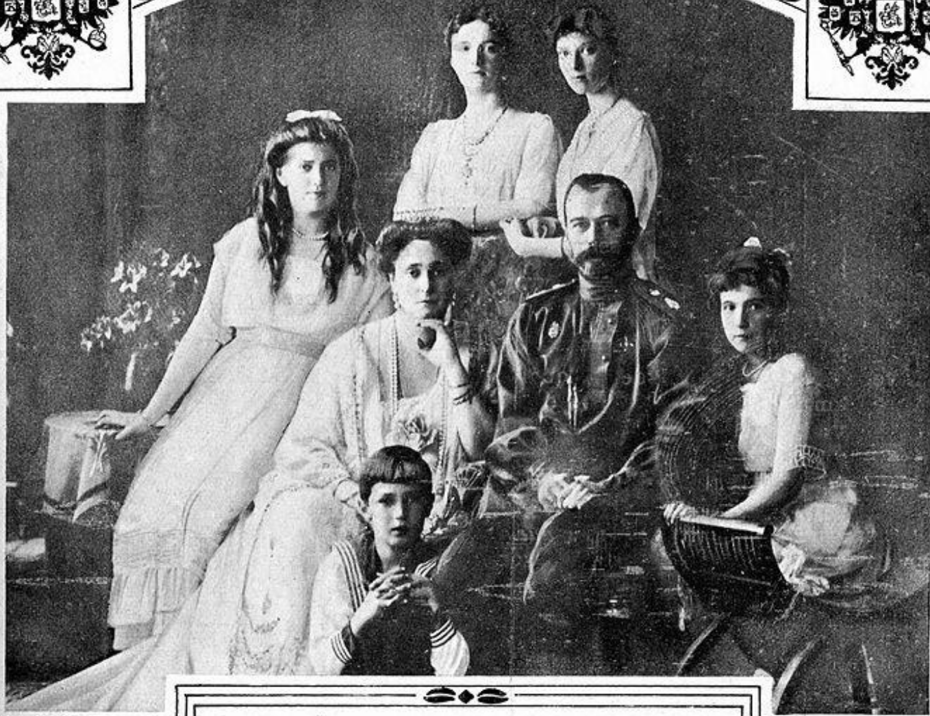
LA FAMIGLIA DELL'EX ZAR DI RUSSIA.