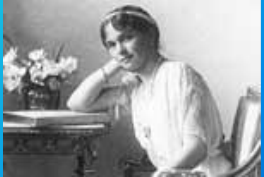
Великая Княжна Ольга

Пошли нам ,Господи, терпенье В годину буйных, мрачных дней, Сносить народное гоненье И пытки наших палачей. И у преддверия могилы Вдохни в уста Твоих рабов Нечеловеческие силы – Молиться кротко за врагов.