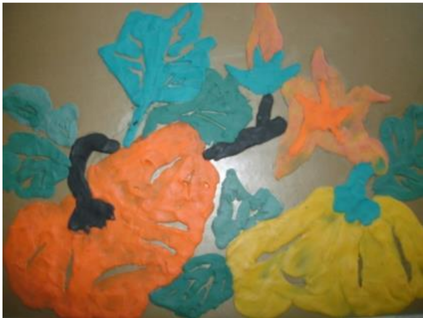
Какие спелые арбузы