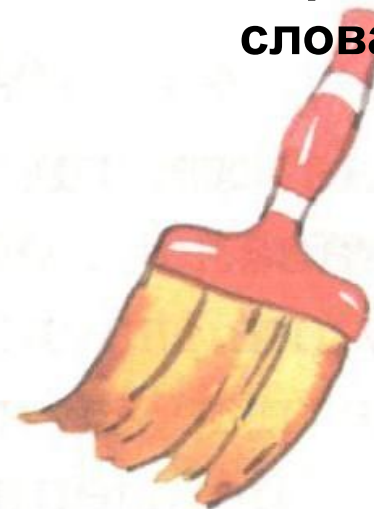
Кисть для покраски