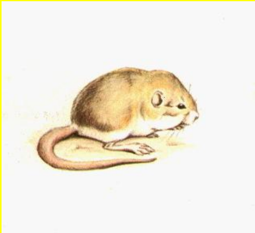
Пятнистый карликовый тушканчик