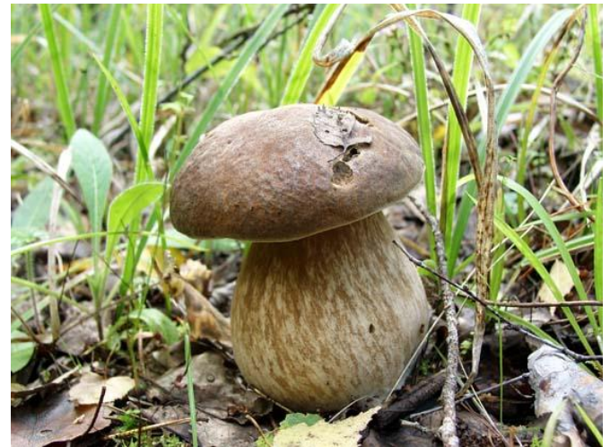
Белый гриб дубовый