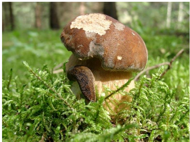
Белый гриб еловый