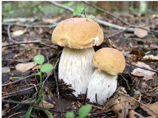
Белый гриб березовый