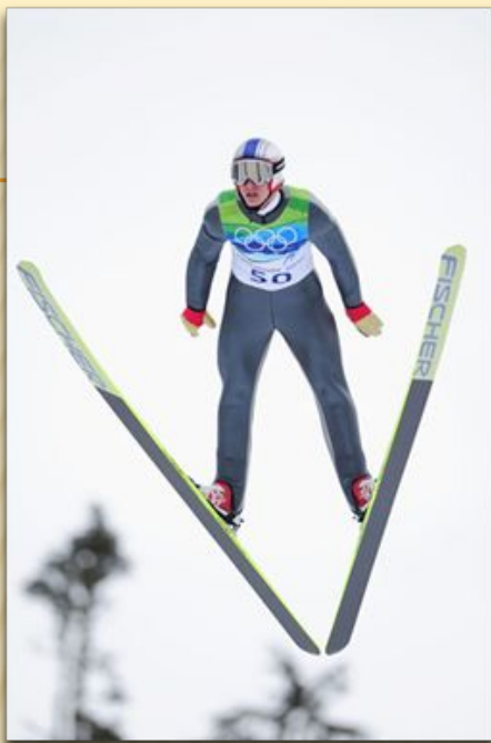
Прыжки с трамплина