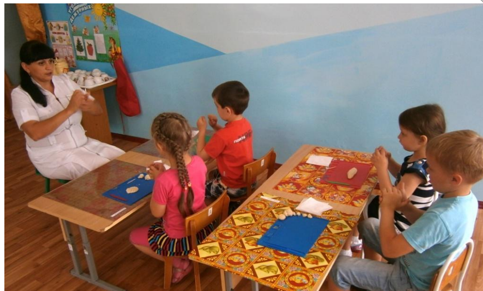
Лепка из солёного теста «Снежный кролик»