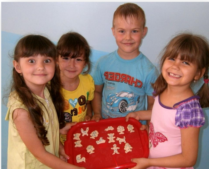
Лепка угощений из сдобного теста «Кремьямчики»