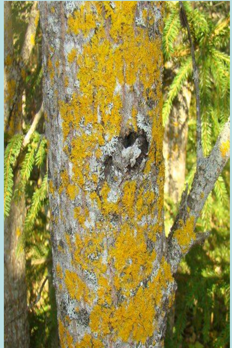
Золотянка или ксантория