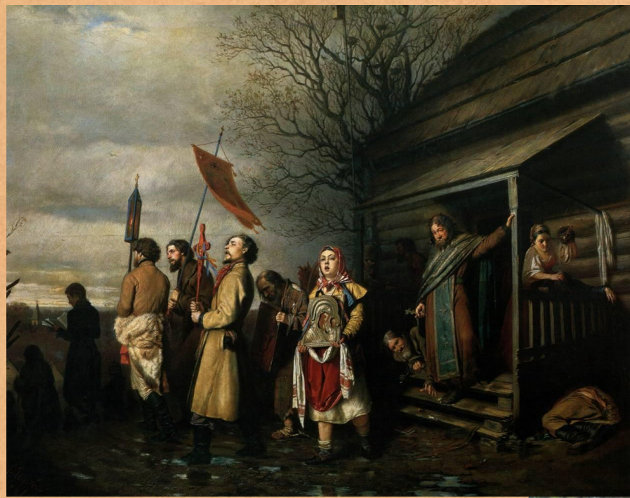
Сельский Крестный ход в старину

Крестный ход - это торжественное шествие служителей церкви и прихожан (люди, которые пришли в церковь) под звон колоколов навстречу воскресшему Христу