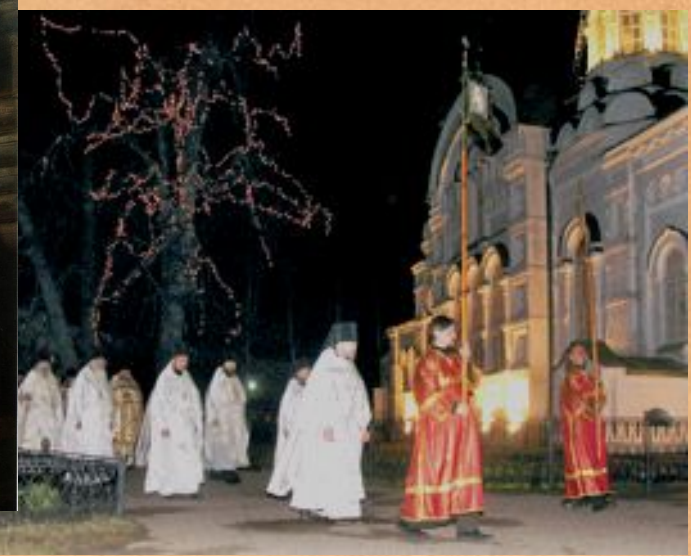
Современный Крестный ход