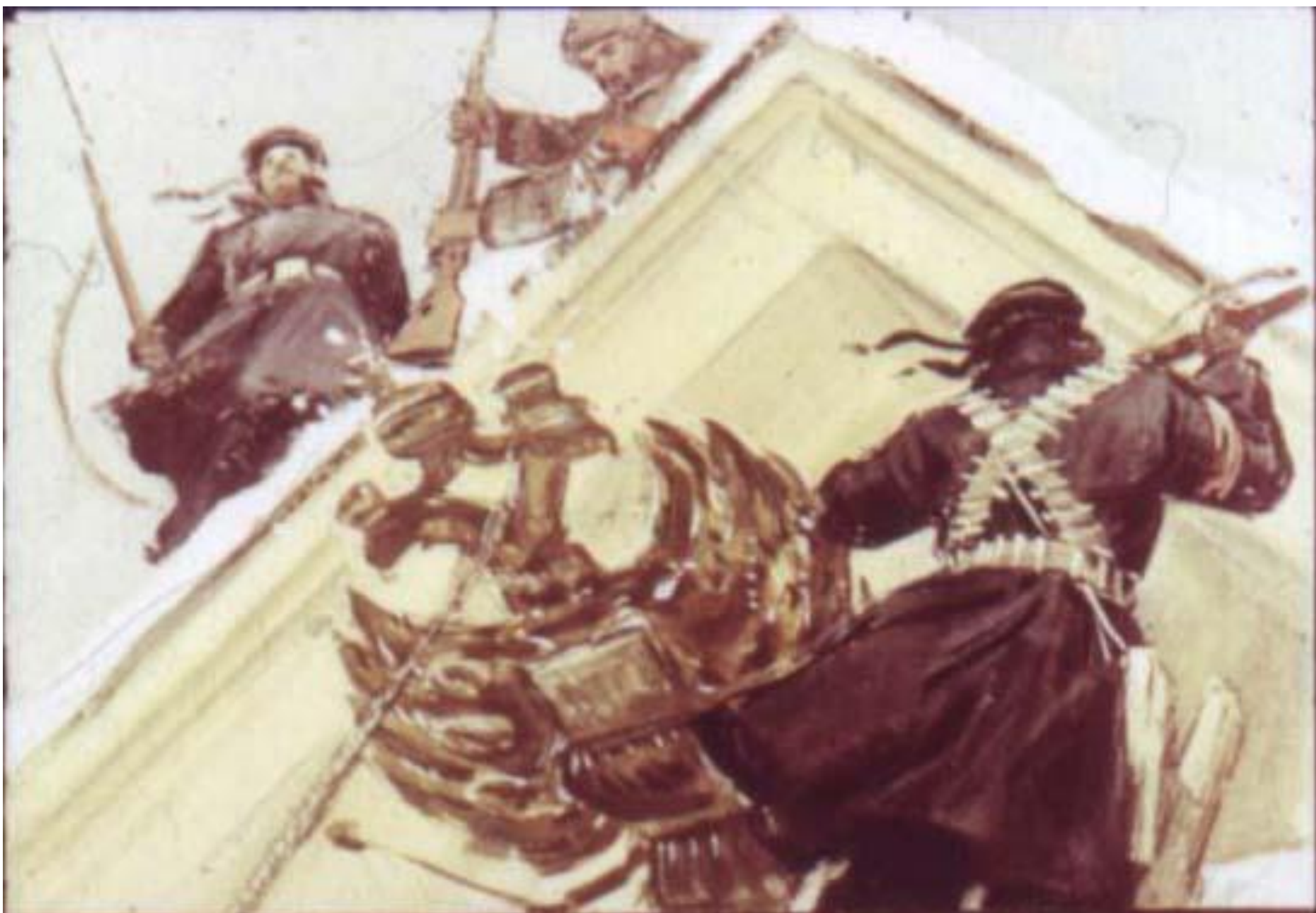
Стреляли в феврале, когда свергали царя.