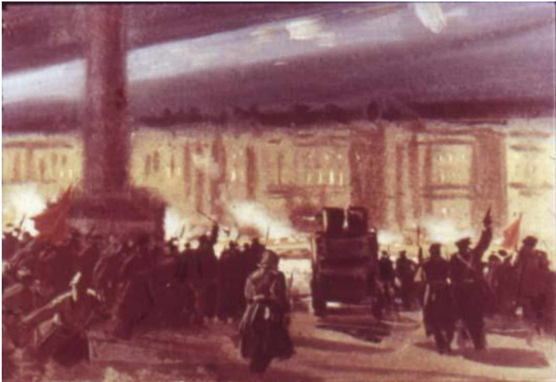
Штурм Зимнего начался через два часа.