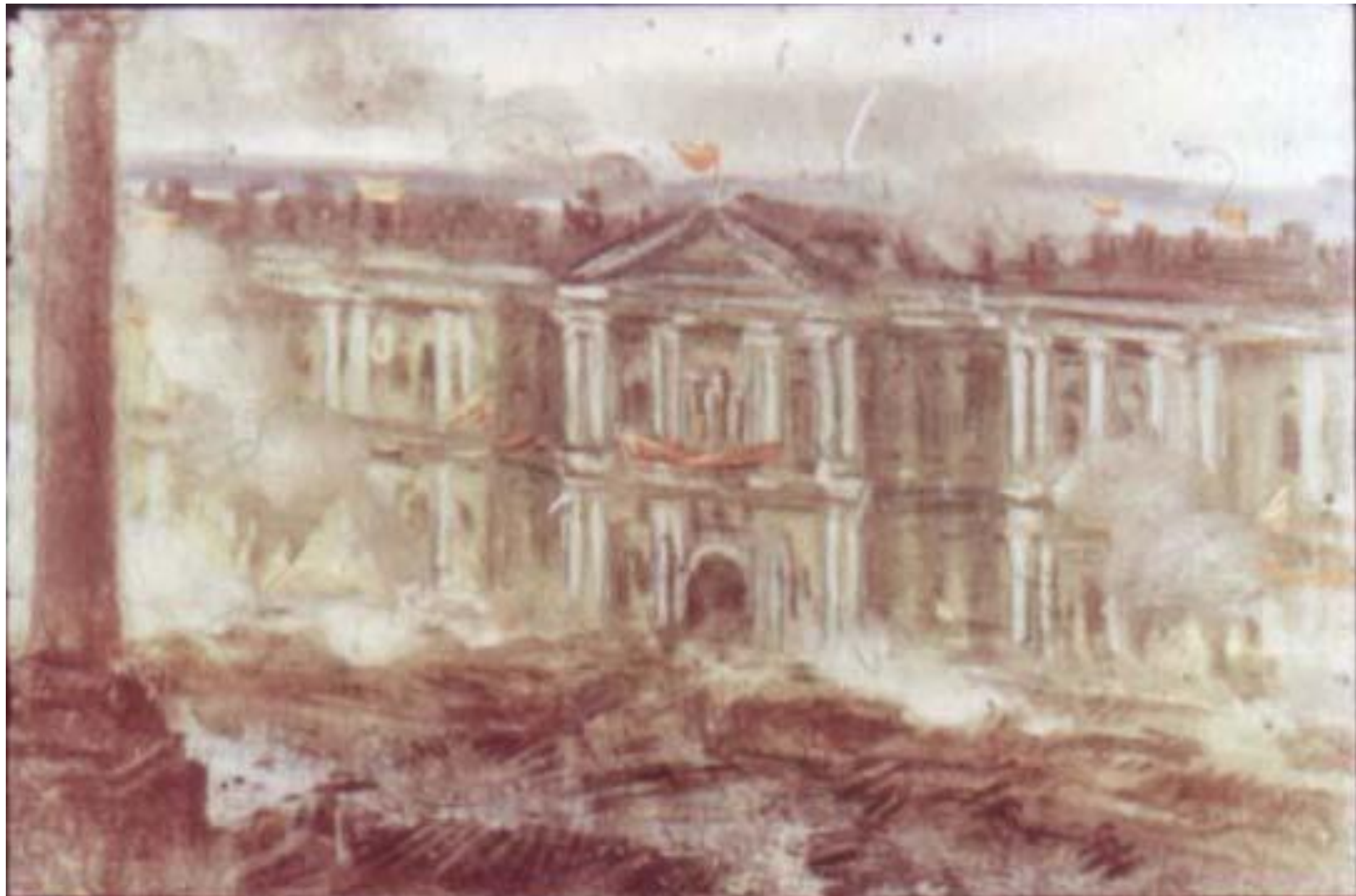
Под утро всё стихло, и Пашка с чердака сразу увидел над Зимним дворцом красные флаги.