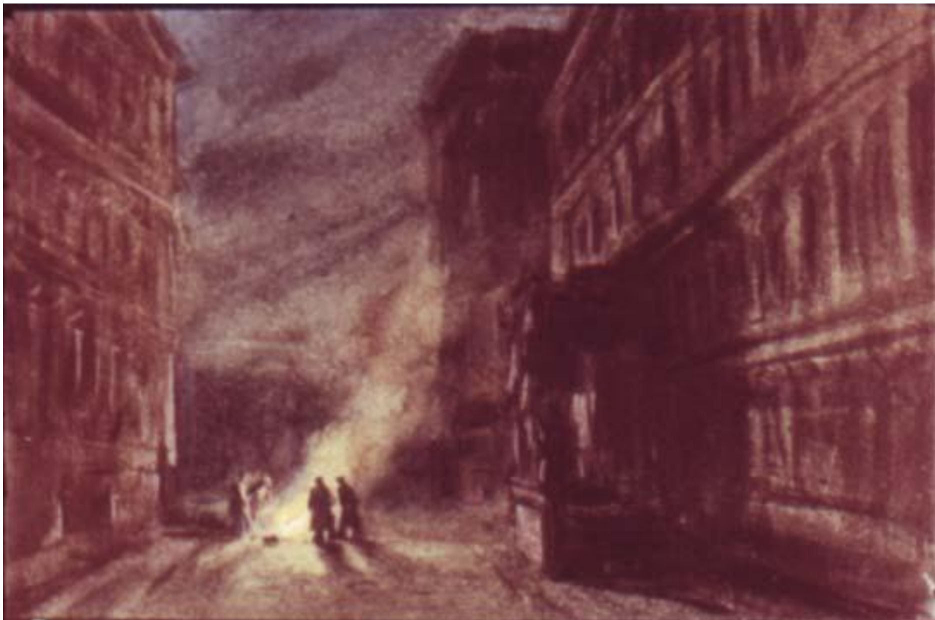
Вспышки выстрелов сверкали недалеко, на площади против Дворца. На углу переулка горел костёр.