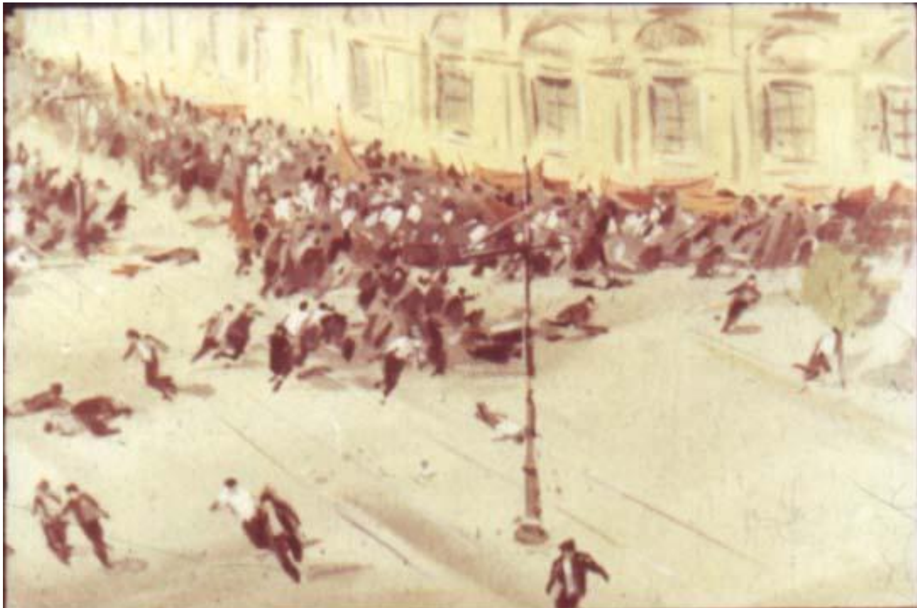
стреляли в июле, когда юнкера, меньшевики и эсеры расстреливали рабочую демонстрацию...