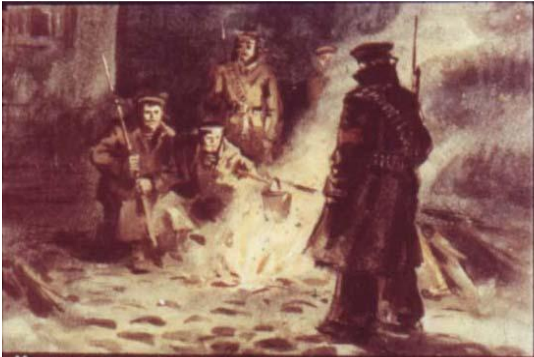
У огня хлопотали молодые парни в матросских шинелях. На костре в ведёрке кипела вода.