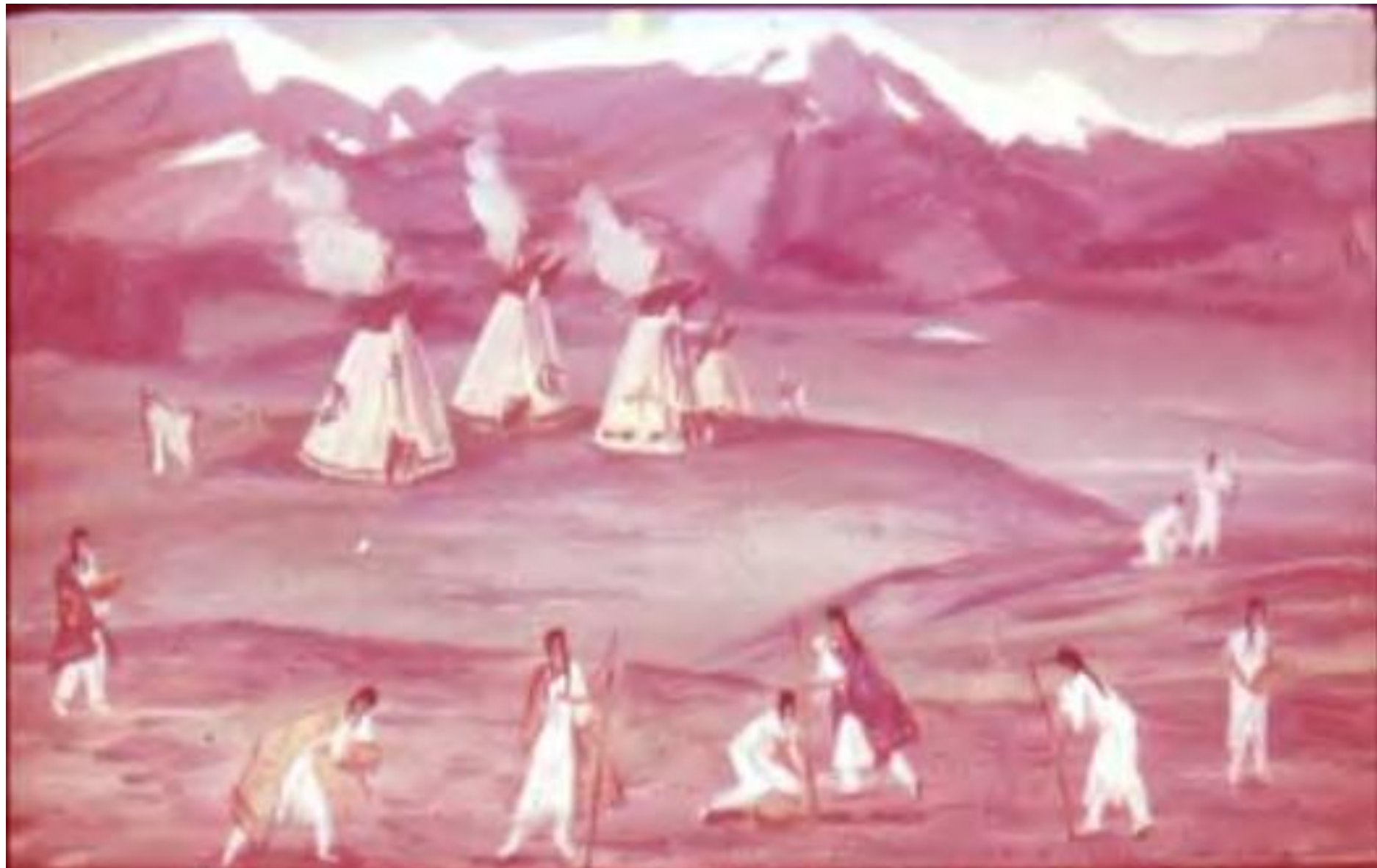
Вокруг счастливого селенья зеленели пышно нивы. Это женщины весною обрабатывали нивы, Хоронили в землю маис на равнинах плодородных.