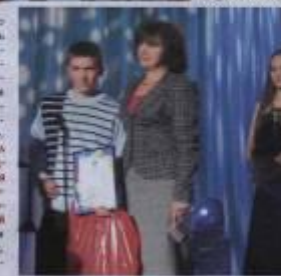
«Почтовое Чтение» (сентябрь, 2007)