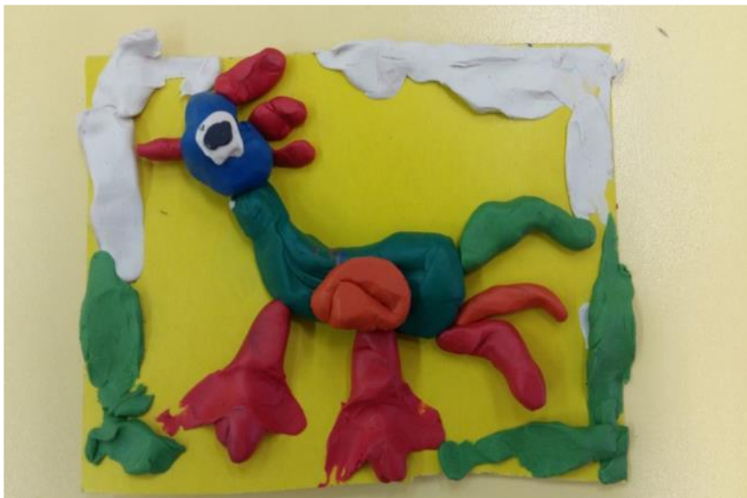
«Петя – петушок»