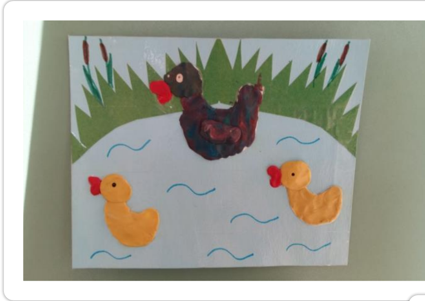
«На птичьем дворе»