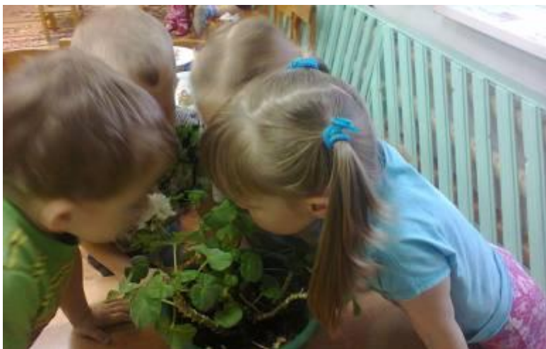
Подвижная игра «Живая клумба»