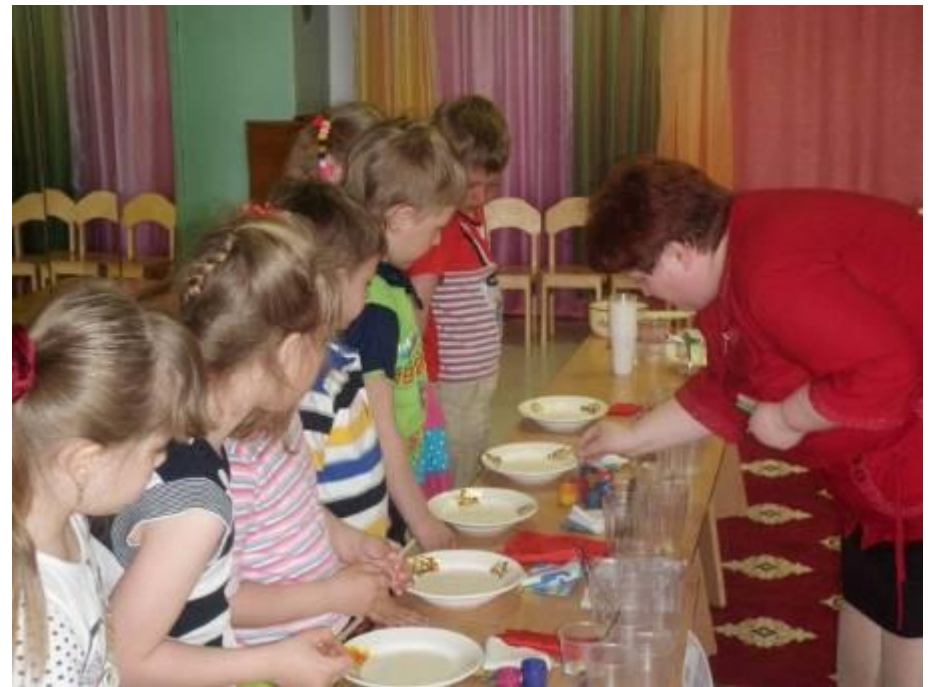
Экологический кружок «Боровичок». Идет исследовательская работа