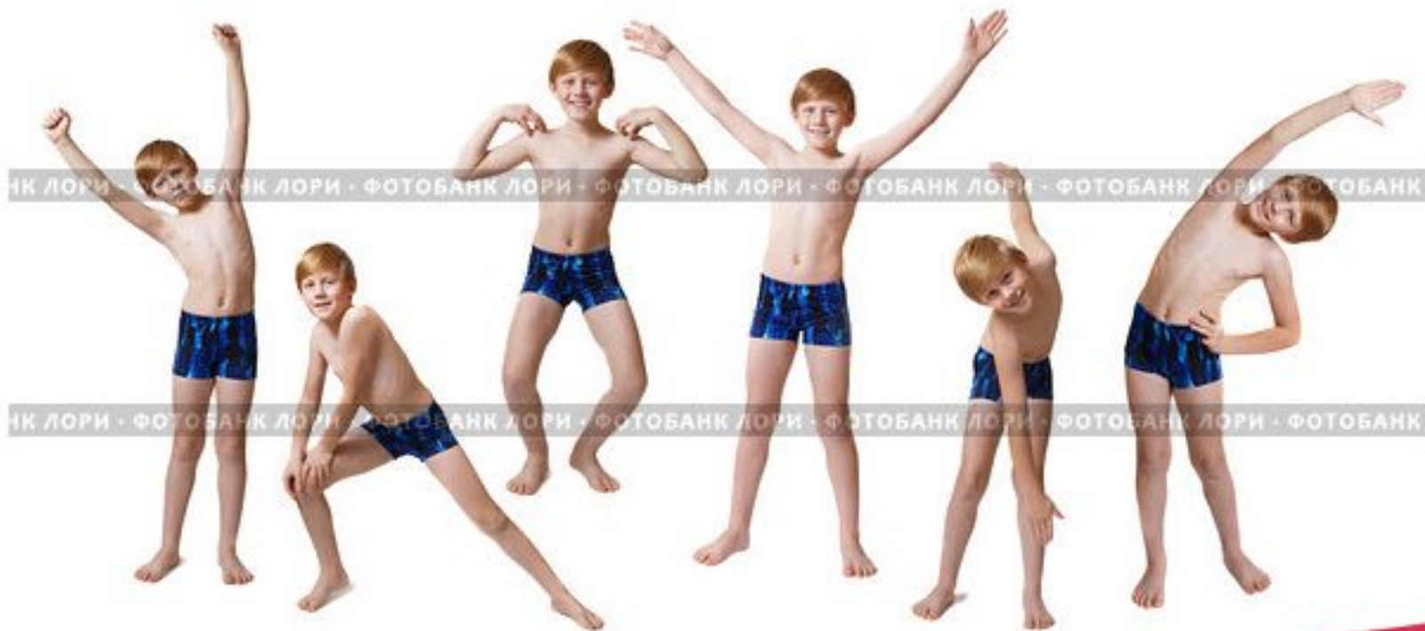
Подросток, делающий зарядку