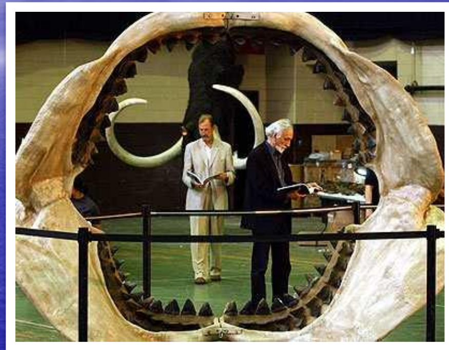
Ископаемые челюсти мегалодона

Это вымерший вид акул. Мегалодон был одним из самых крупных хищников за всю историю Земли. Его длина составляла 22 метра, а вес – 50 тонн.