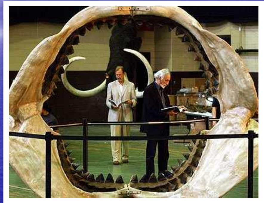
Ископаемые челюсти мегалодона

Это вымерший вид акул. Мегалодон был одним из самых крупных хищников за всю историю Земли. Его длина составляла 22 метра, а вес – 50 тонн.