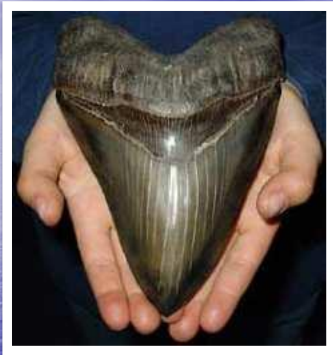
Ископаемый зуб мегалодона