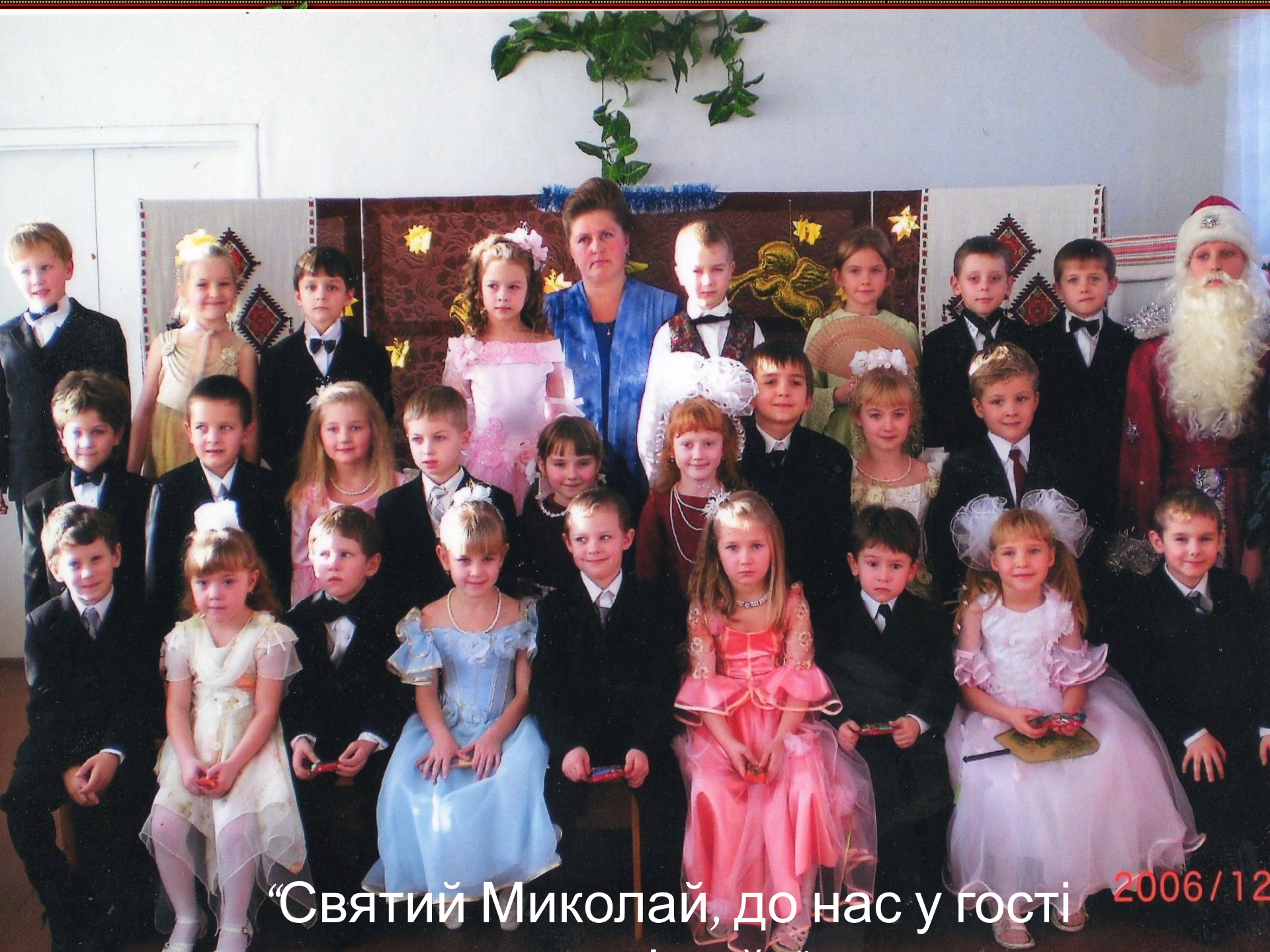
“Святий Миколай, до нас у гості