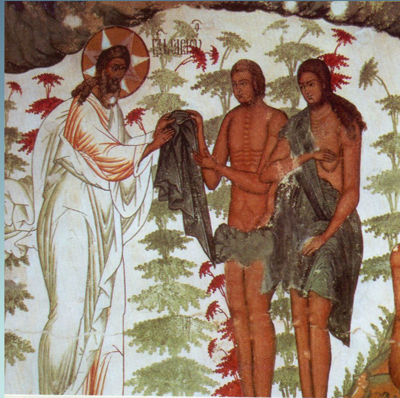
Адам и Ева. Деталь фрески Воскресения Христова Воскресенского собора. Город Романов-Борисоглебск (Тутаев)

Хорошо было Адаму и Еве жить в раю. Между всеми райскими деревьями были два особенно замечательные.