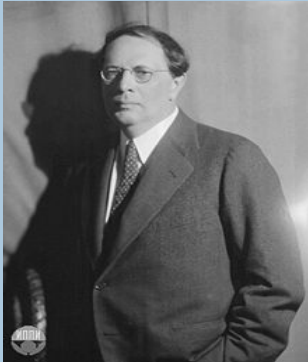
Алексей Николаевич Толстой