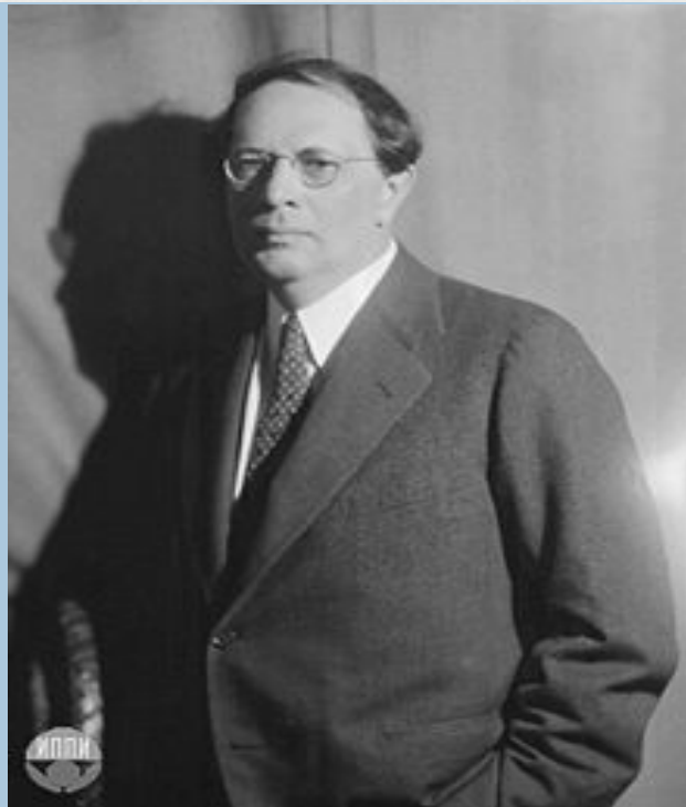
Алексей Николаевич Толстой