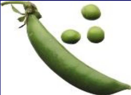
гор о х