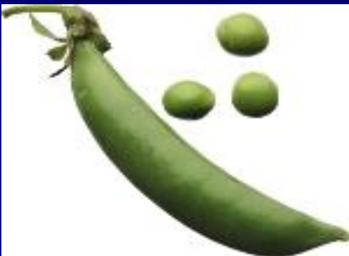
г о рох