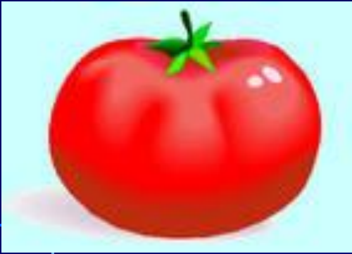
п о мидор