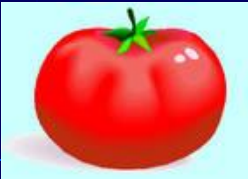
п о мидор