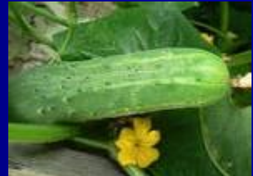
огур е ц