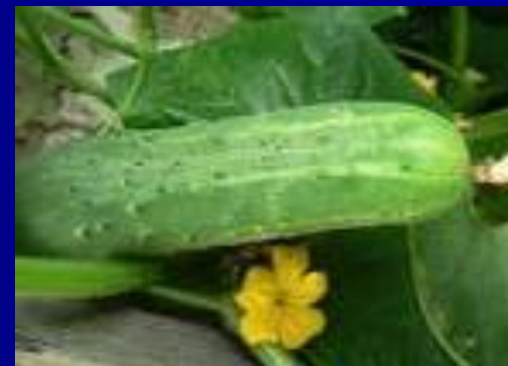
о г урец