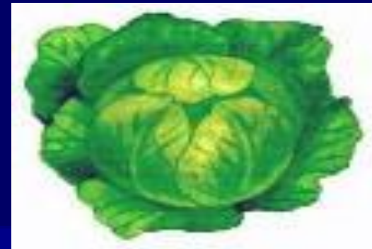
к а пуст а