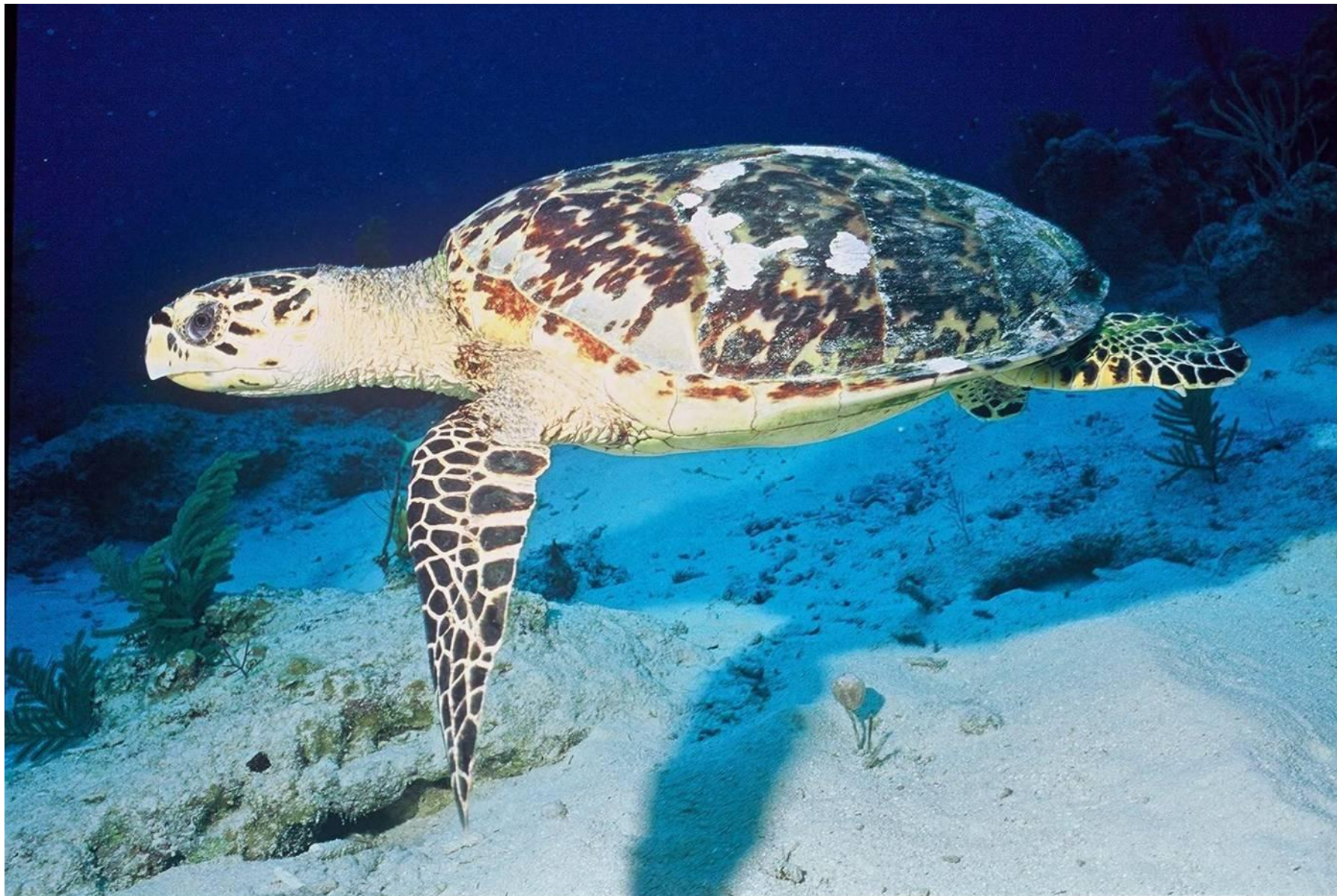
бисса – морская черепаха