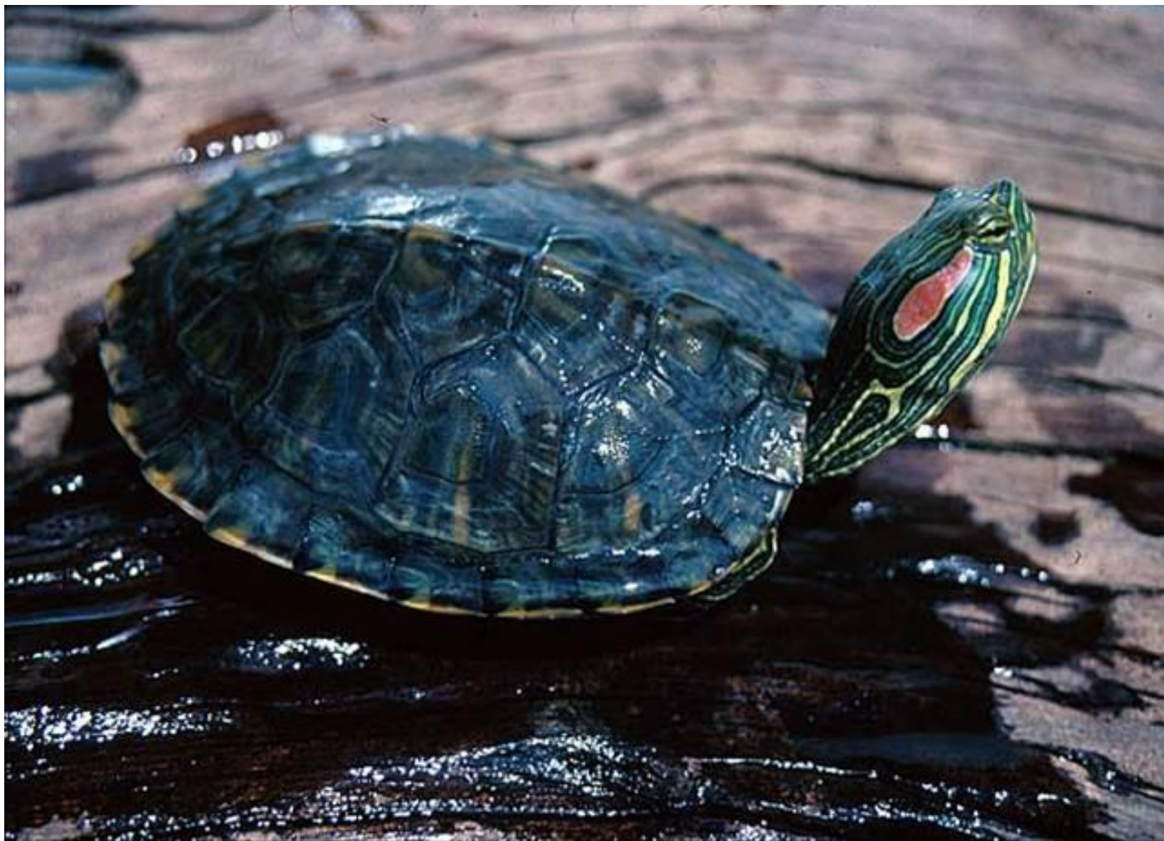
красноухая скользящая черепаха