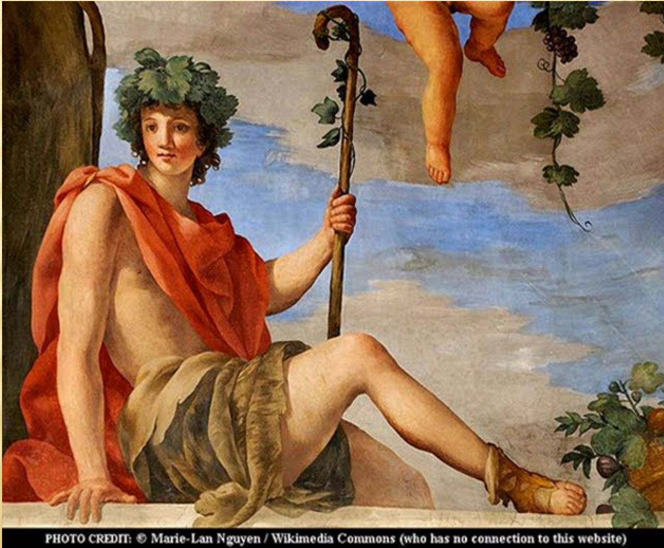
PHOTO CREDIT: © Marie-Lan Nguyen / Wikimedia Commons (who has no connection to this website)

Дионис (Вакх) — бог виноградарства и виноделия, объект целого ряда культов и мистерий. Изображался то в виде тучного пожилого мужчины, то в виде юноши с венком из виноградных листьев на голове.