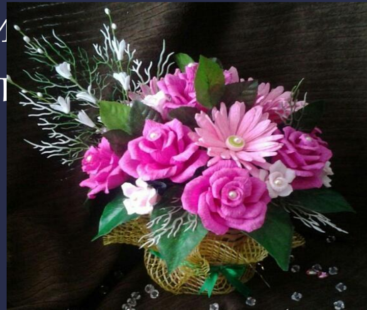
Автор: Хон Е.А.