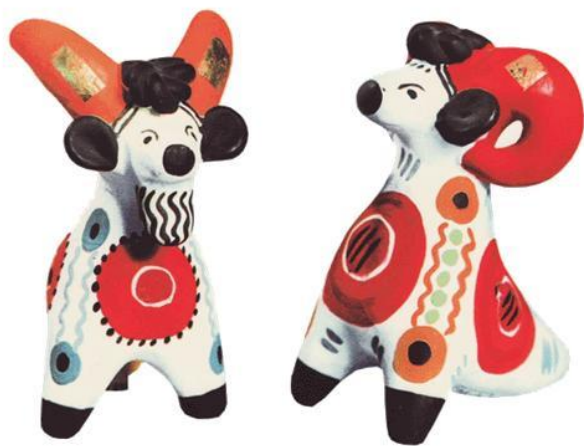
СВИСТУЛЬКИ – КОЗЁЛ И БАРАН

Свистульки - самый старинный вид Дымковской игрушки. В старину свистульки лепили к весеннему празднику «Свистунья» и в основном изготавливались в виде животных. Дымковские свистульки имеют небольшую полость и несколько отверстий, которые позволяют менять тон свиста.