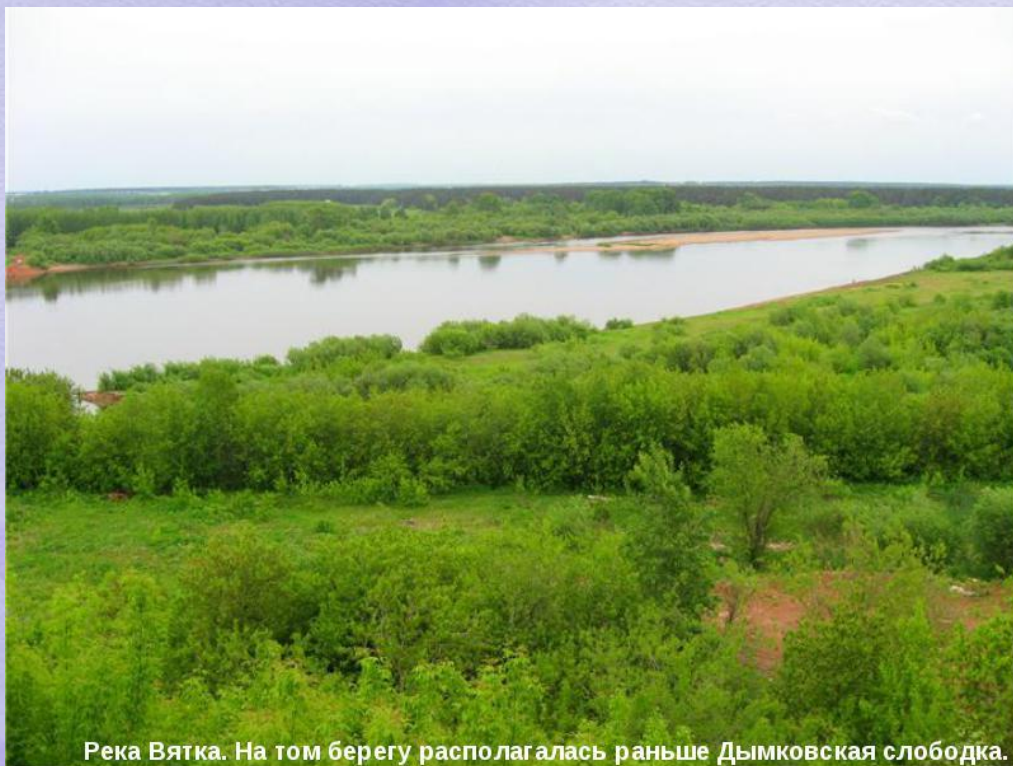
Река Вятка. На том берегу располагалась раньше Дымковская слободка.

Красную глину собирали весной после половодья на реке Вятке и смешивали с мелким речным песком, чтобы она не трескалась при обжиге в печи.