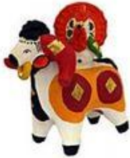
БАРАШЕК И КУРОЧКА

Дымковской игрушке присуща некоторая жизнерадостность и ирония. Все животные ярко раскрашены и наряжены в цветастые шаровары. Козлы и бараны играют на гармошке, зайцы сажают морковь. Фантазия мастеров безгранична.