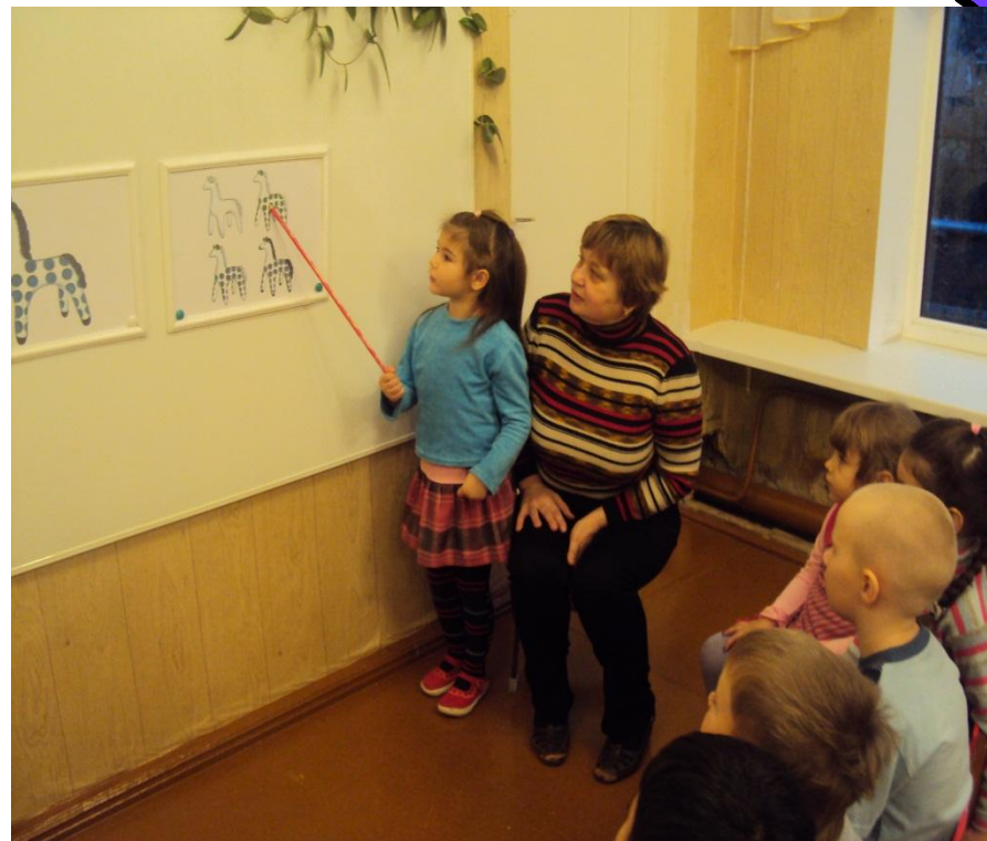
фото № 1

Учить передавать в лепке характерные особенности дымковских животных, их позы, лепить ноги и туловище лошадки из одного куска, голову и шею из другого; закреплять умение пользоваться стеклой для надрезания; знакомить с художественными традициями в изготовлении игрушек из глины.