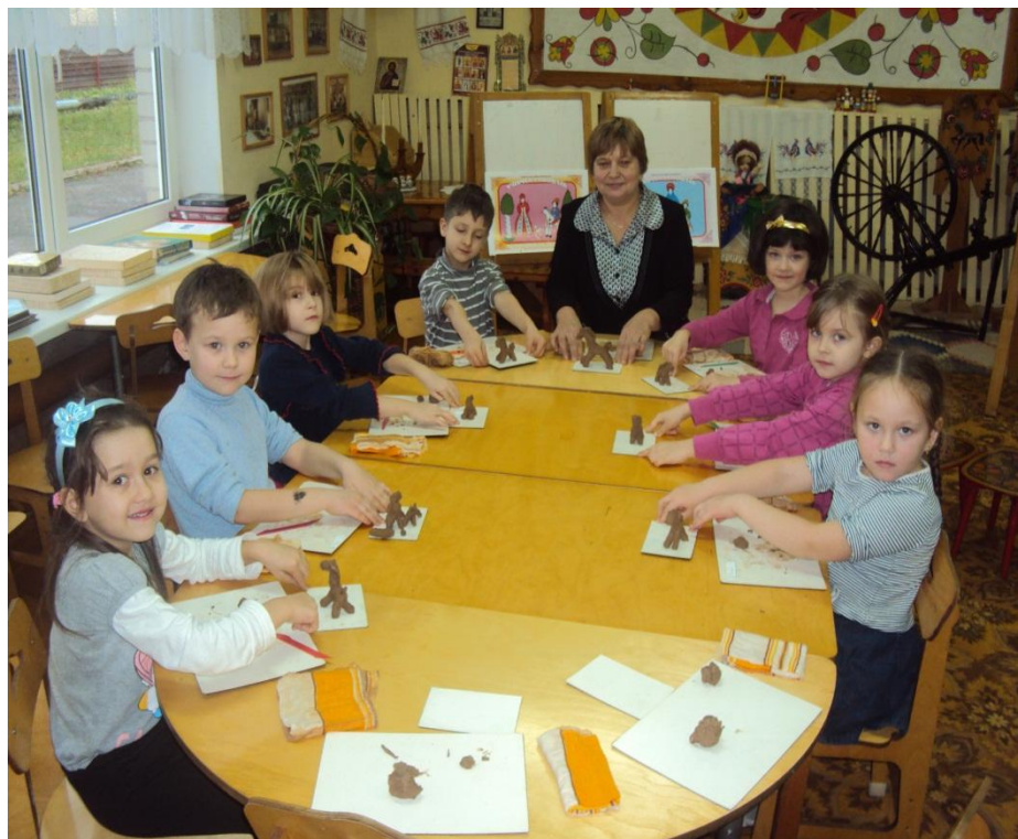
Фото № 7

Все запомнили последовательность работы. Давайте повторим по схеме (2-3 ребёнка рассказывают по очереди с опорой на схему, дети дополняют). А теперь приступайте к работе. В процессе лепки обращаю внимание детей на пропорции между частями тела животного. А ещё дымковские мастера, придают своим игрушкам такую позу, по которой сразу видно, что их лошадки гордые, весёлые.