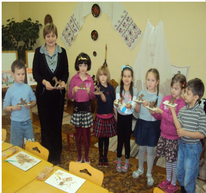
Фото № 8