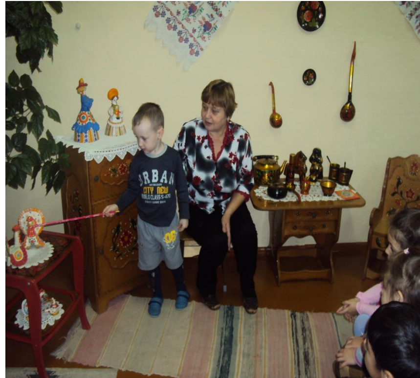
Фото № 2

Знакомство с искусством - дымковская игрушка; экскурсия в музей «Русская изба» на выставку дымковских игрушек; рассматривание наглядно-методических пособий «Дымковская игрушка», фотографий, слайдов; лепка исходных форм (цилиндр, конус, жгутик); работа со схемами.