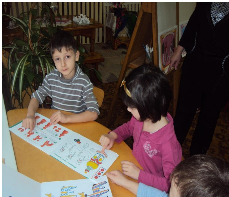
Фото № 6