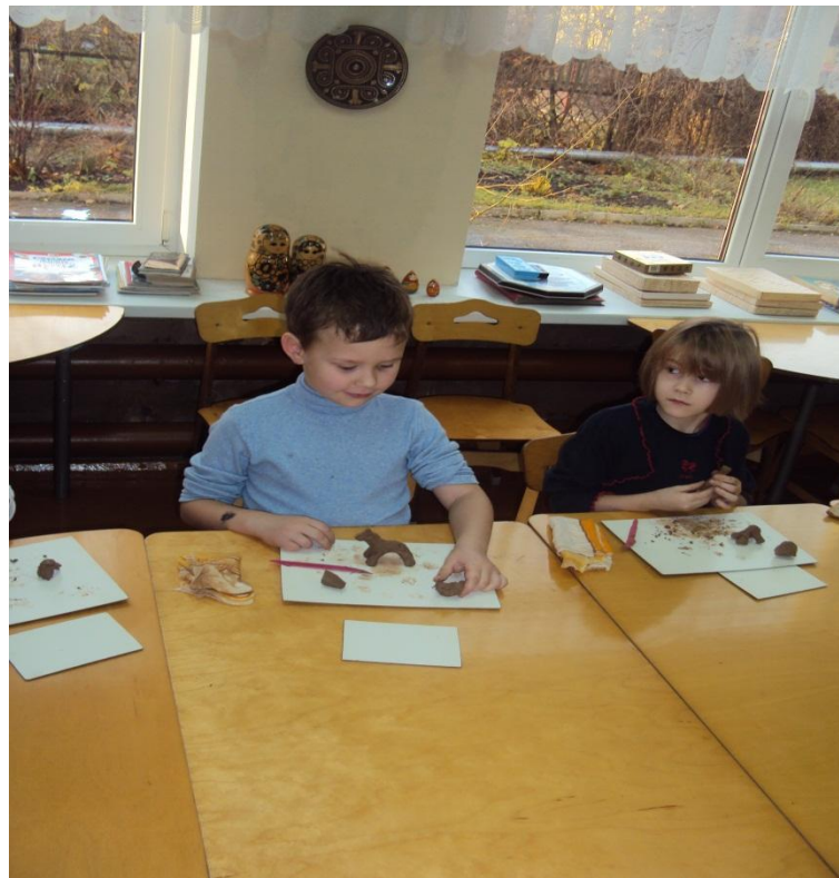
Фото № 5