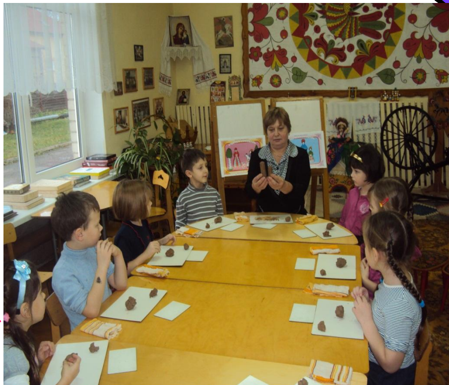
Фото № 3

Ребята, вы помните, где находятся в нашем музее дымковская игрушка? Как вы ее узнали? Да, она очень яркая и изготовлена из глины. Дымковские мастера очень постарались. А кто заметил новую игрушку? Молодцы, вы очень внимательны. Эту игрушку нам прислали мастера из Дымки, а вместе с ней вот это, посмотрите. Что это такое? Правильно, глину. А ещё письмо, послушайте: «Дорогие ребята! Для ярмарки нам нужно вылепить очень много лошадок, просим вас нам помочь.» Ну что, хотите побыть дымковскими мастерами? Но чтобы в мастерскую нам попасть, нужно ключик отыскать.