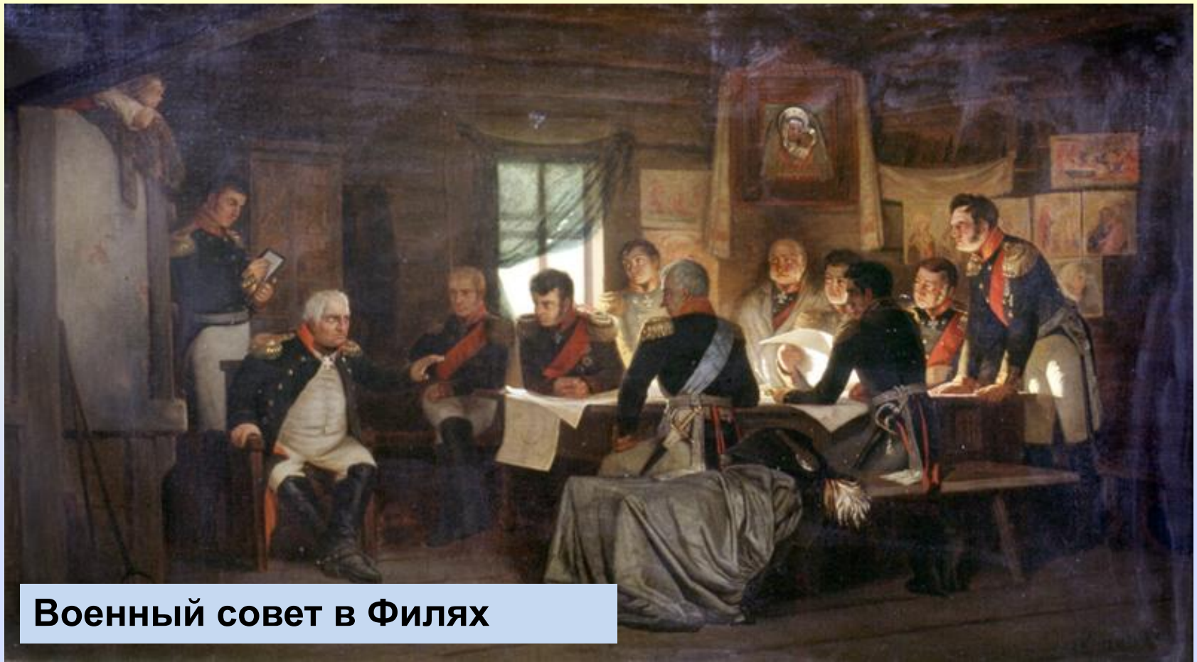
Военный совет в Филях

Кутузов собрал всех генералов в деревне Филя на военный совет. Русские войска из-за больших потерь отступали к Москве. Кутузов ставит вопрос: давать бой под Москвой или сдать столицу. Решающими стали слова Кутузова «Пока цела армия, цела и Россия» . Было решено оставить Москву.