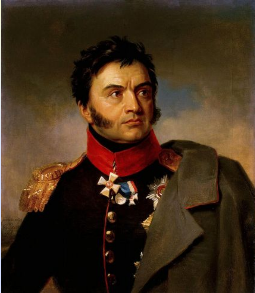
Раевский Николай Николаевич