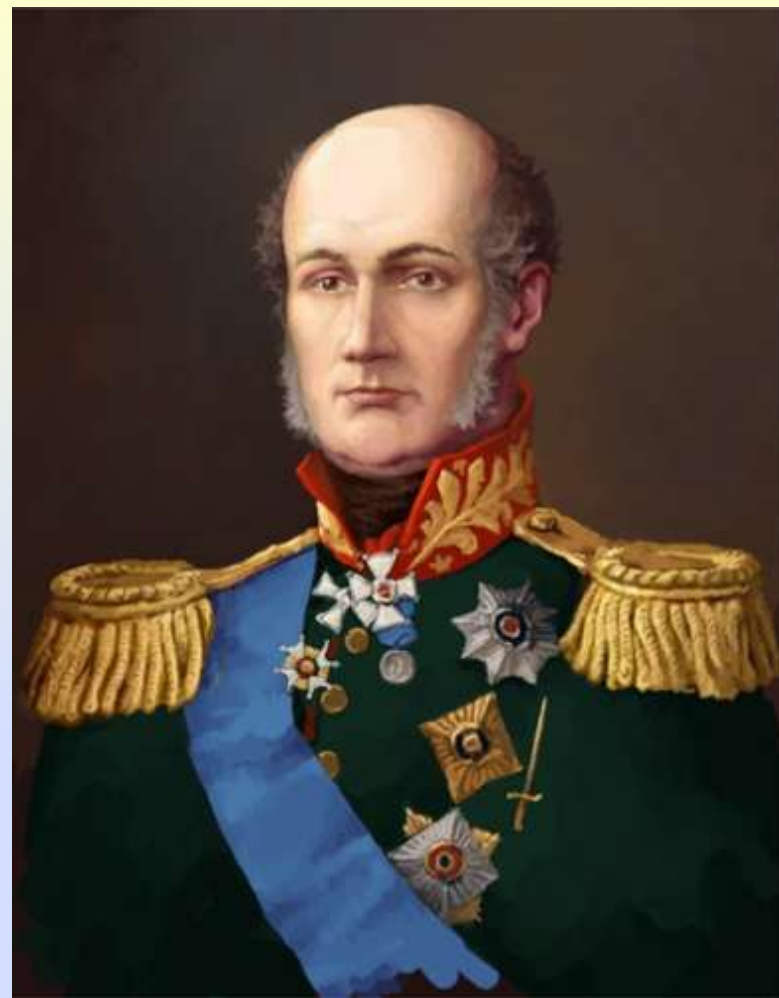
Михаил Богданович Барклай-де-Толли