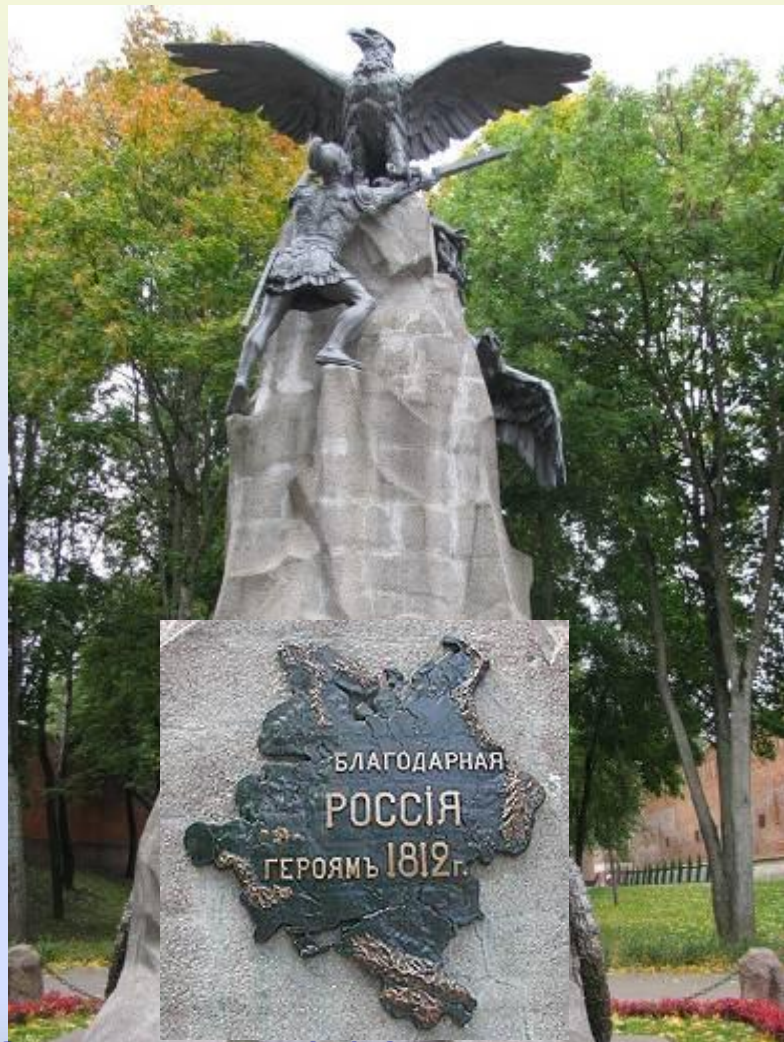
Памятник героям Отечественной войны 1812 года в Смоленске