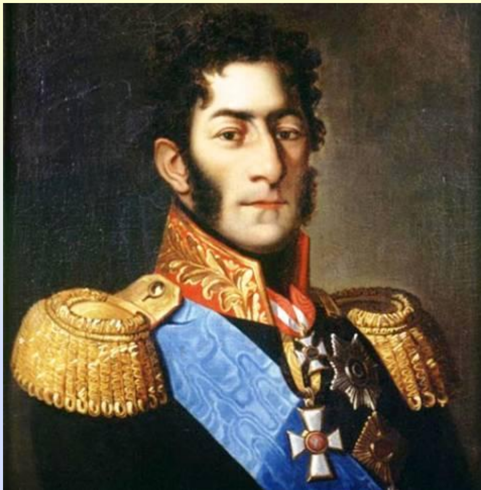
Багратион Петр Иванович