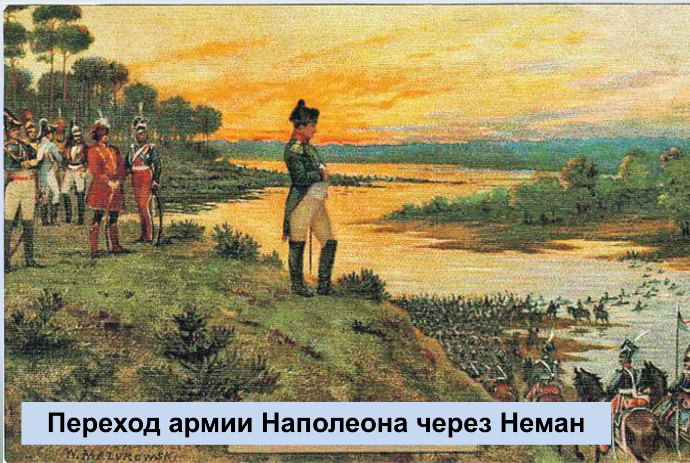
Переход армии Наполеона через Неман

Летом 1812 года огромное французское войско под командованием Наполеона Бонапарта вторглось на российскую территорию. Началась Отечественная война.