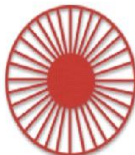
Строение шляпки снизу