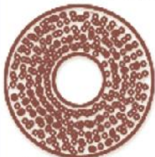
Строение шляпки снизу