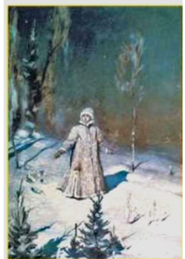
В. Васнецов. Снегурочка