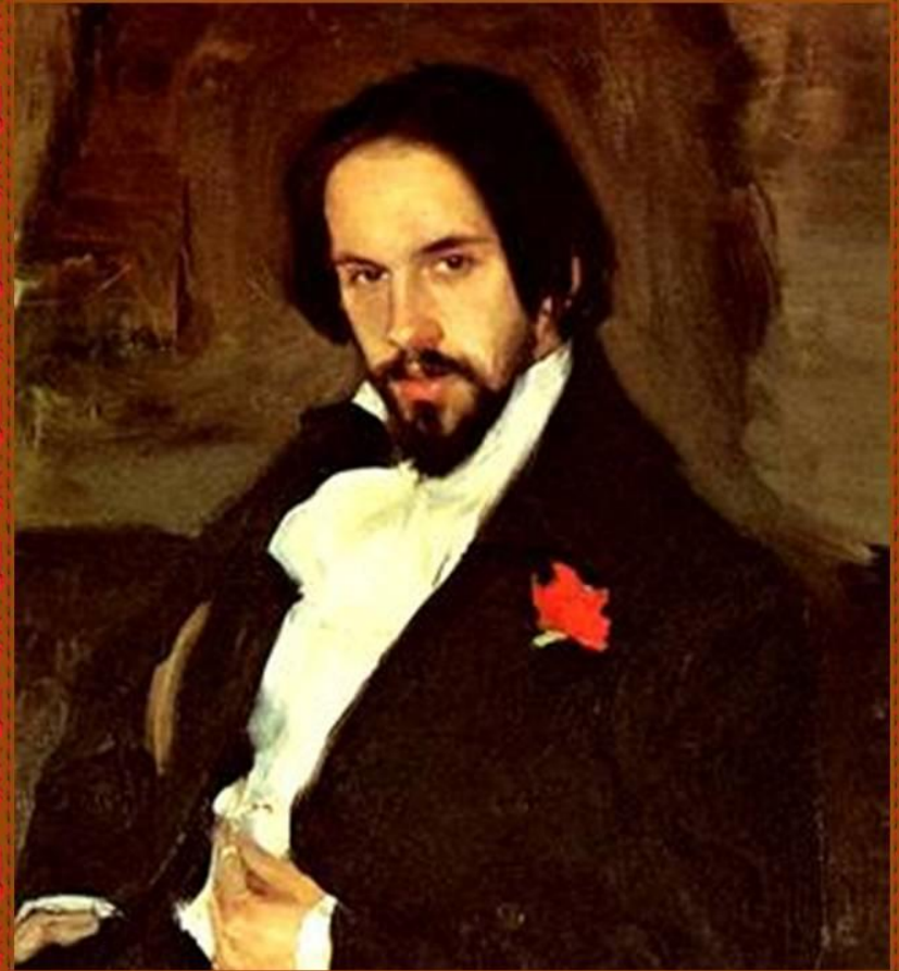
Билибин Иван Яковлевич