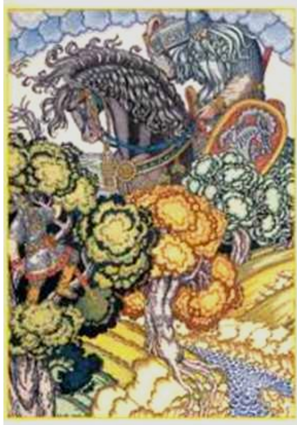
И. Билибин Илья Муромец и Святогор