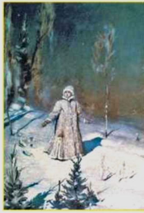
В. Васнецов. Снегурочка