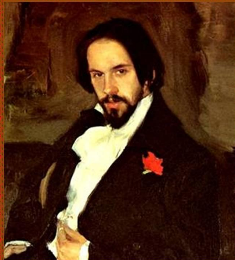
Билибин Иван Яковлевич