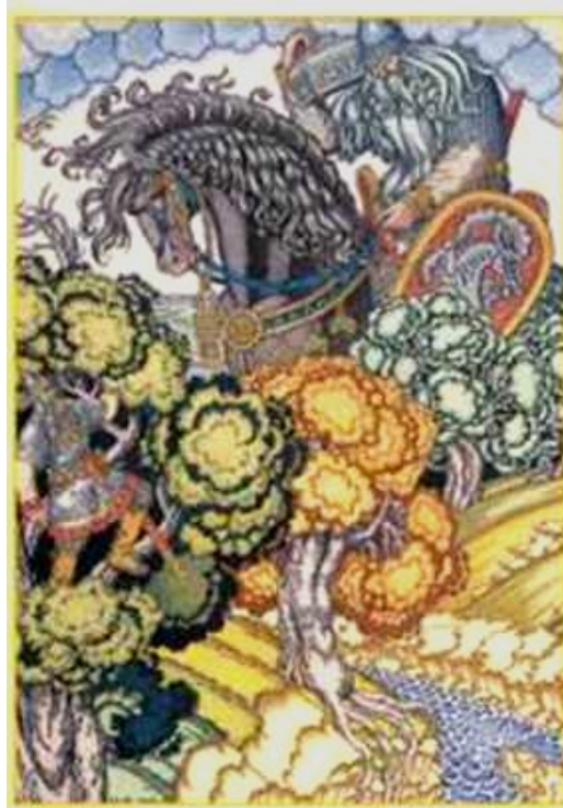
И. Билибин Илья Муромец и Святогор