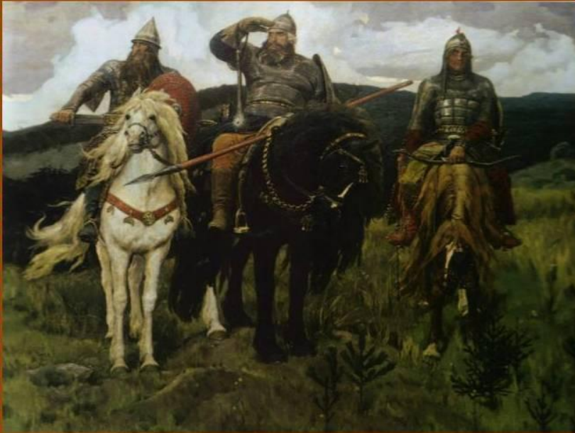
Картина «Богатыри» (Три богатыря). 1898