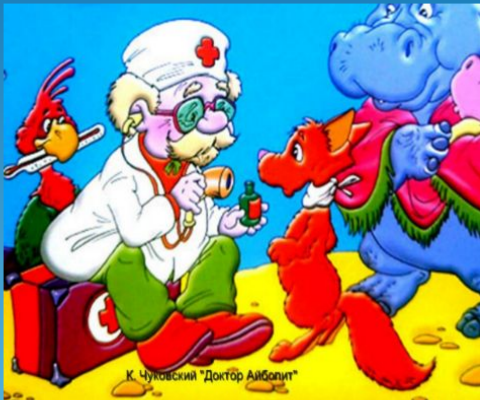
К. Чуковский "Доктор Айболит"