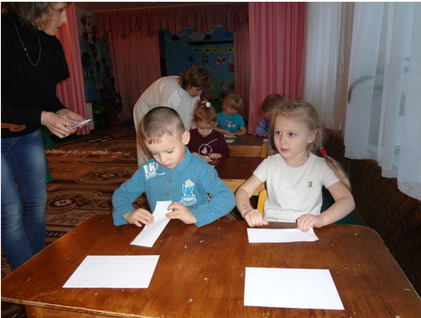
«Изготовление модулей для уха зайчика»