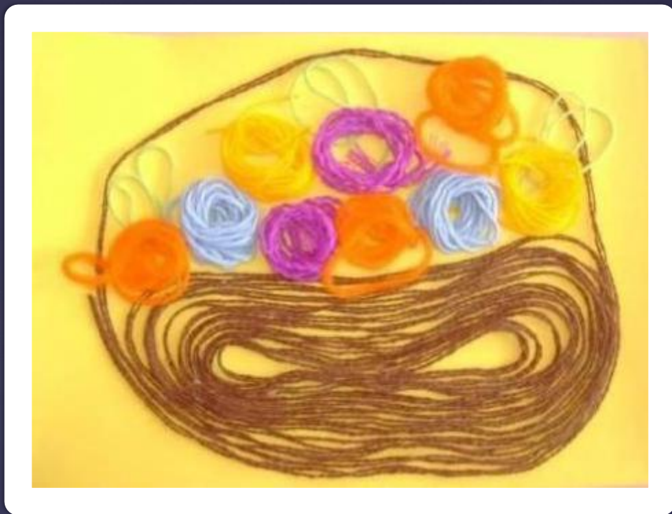
Корзина с цветами.