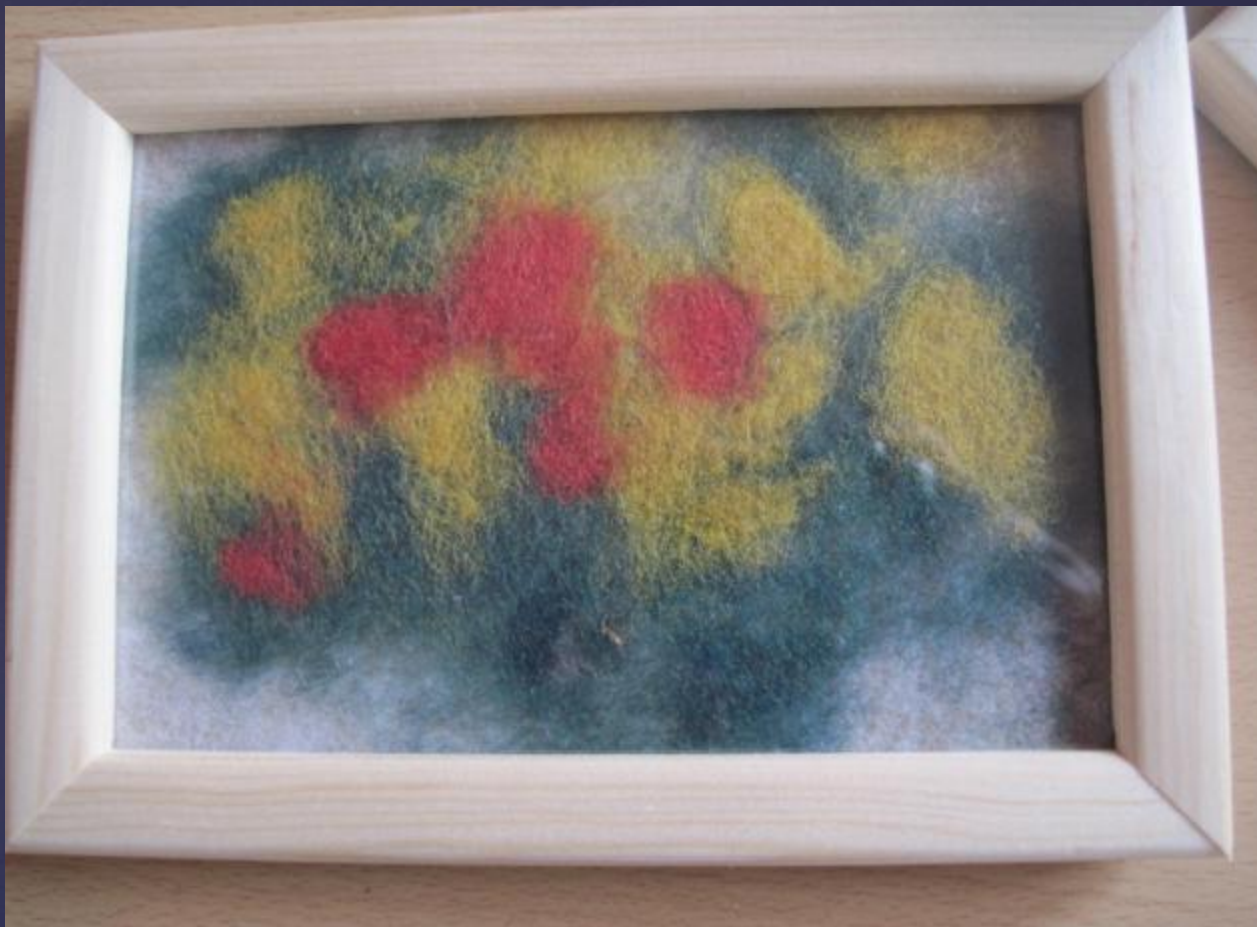
Цветы на лужайке