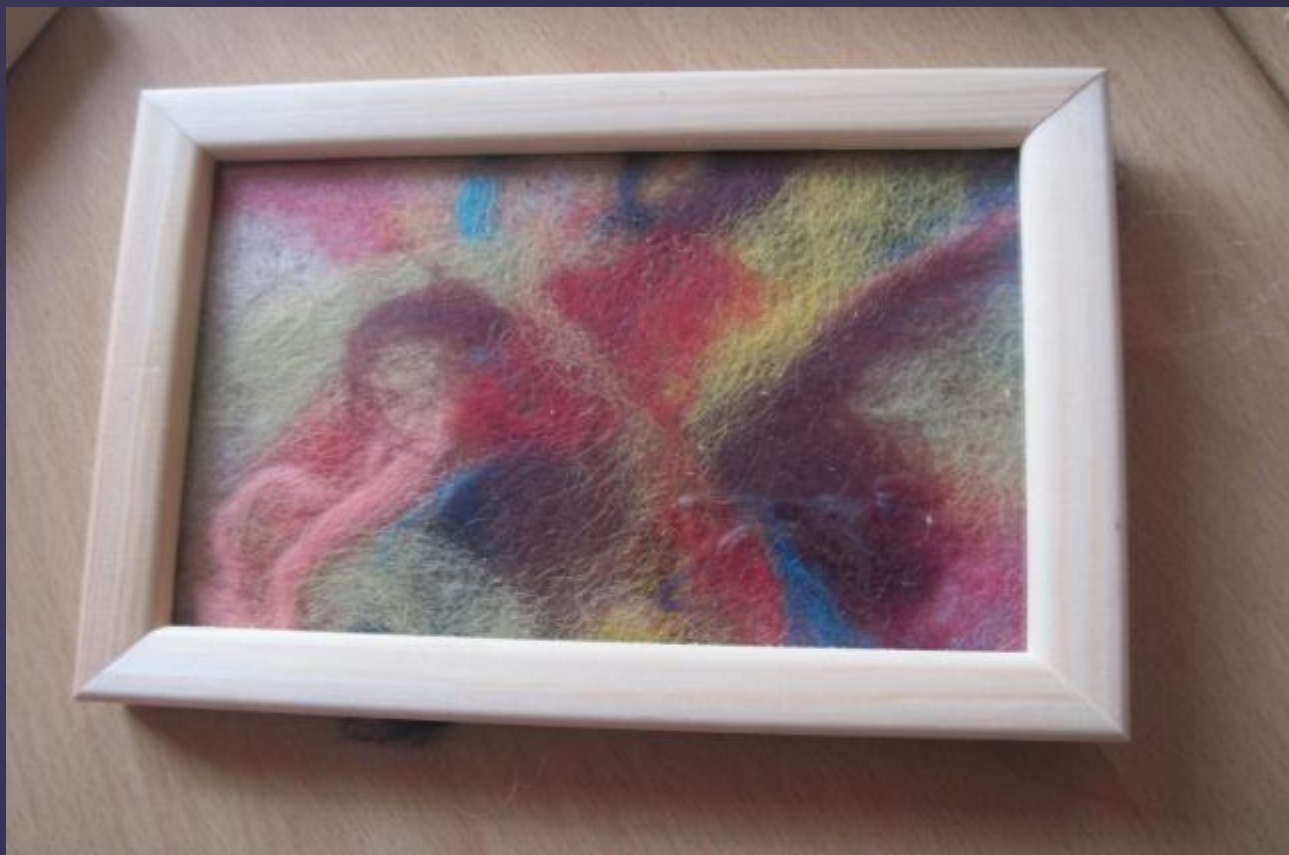
Цветы на Марсе