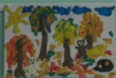
«Сидит малютка в дыр»

Сувениры к празднику 2014-2015 годов «Поздравительная открытка»