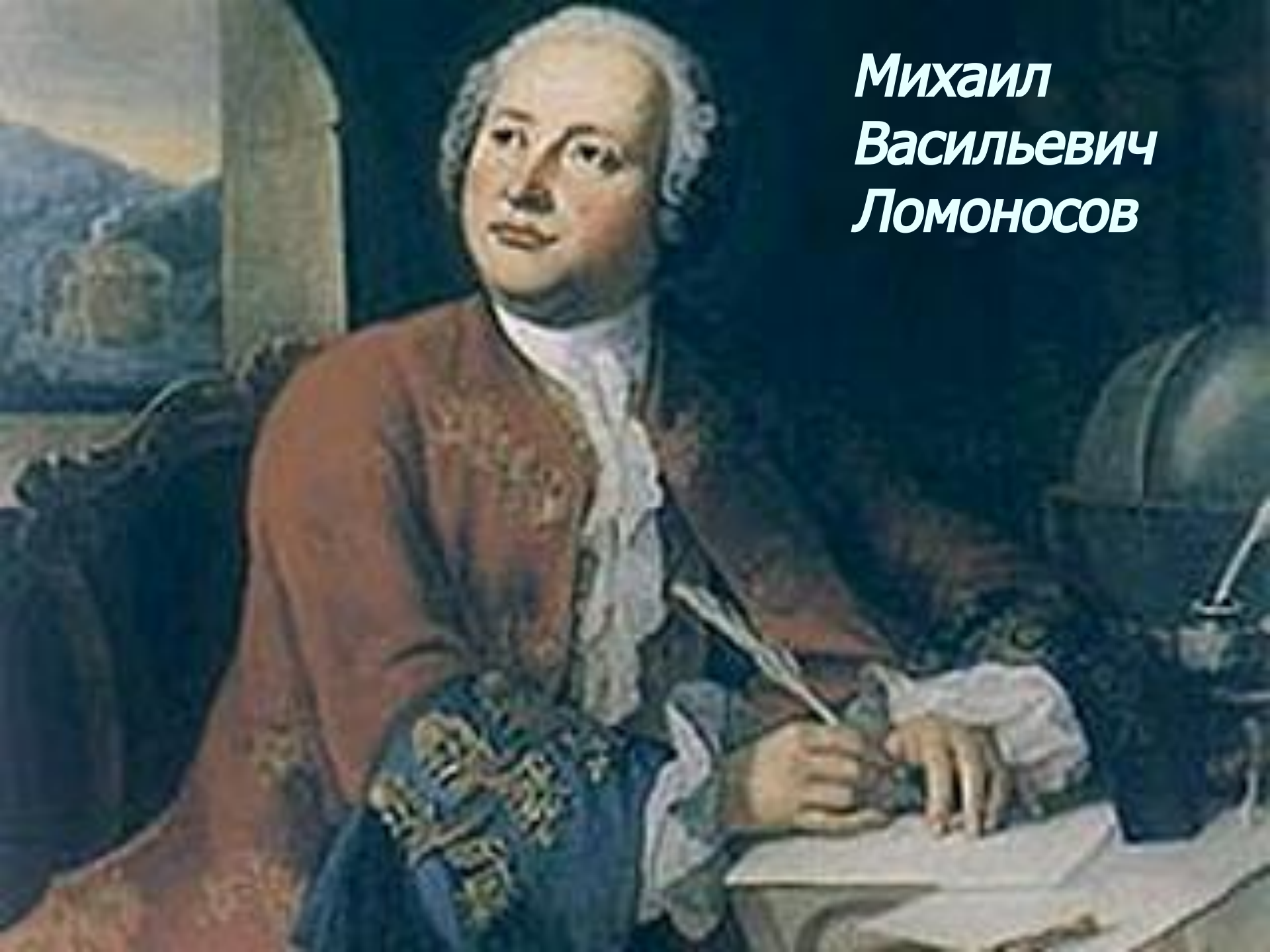
Михаил Васильевич Ломоносов