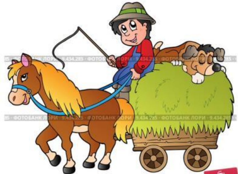
Hay cart with cartoon farmer