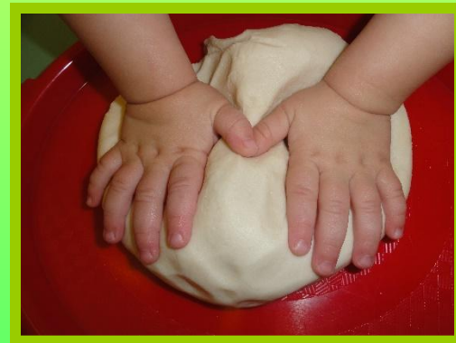
Разминаем тесто ладошками