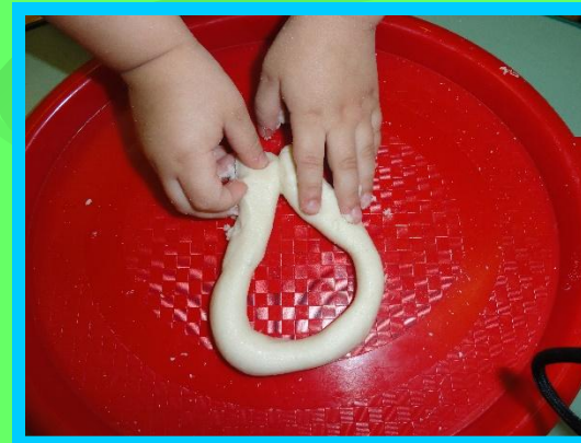
Соединяем концы палочки, прижимая их друг к другу