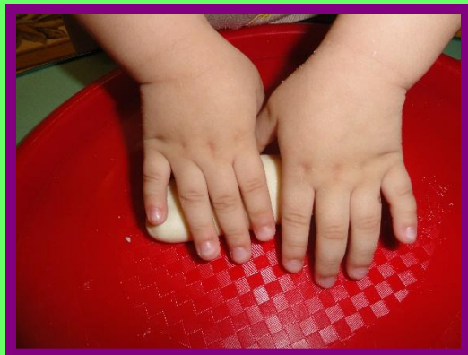
Раскатываем тесто ладошками