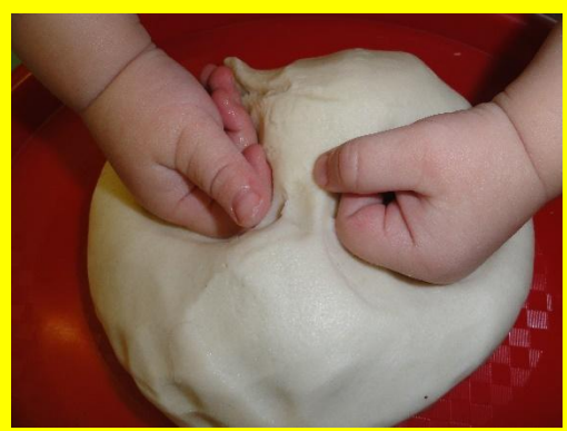
Разминаем тесто кулачками