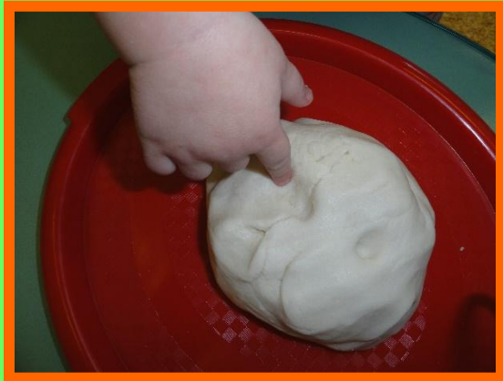
Делать пальцами углубление