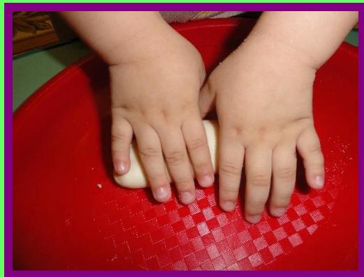
Раскатываем тесто ладошками