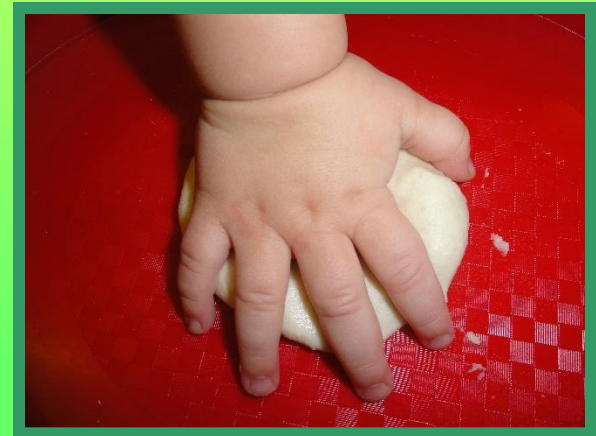
Сплющиваем тесто ладошкой