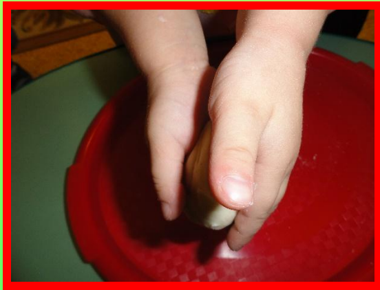
Раскатывать круговыми движениями ладоней