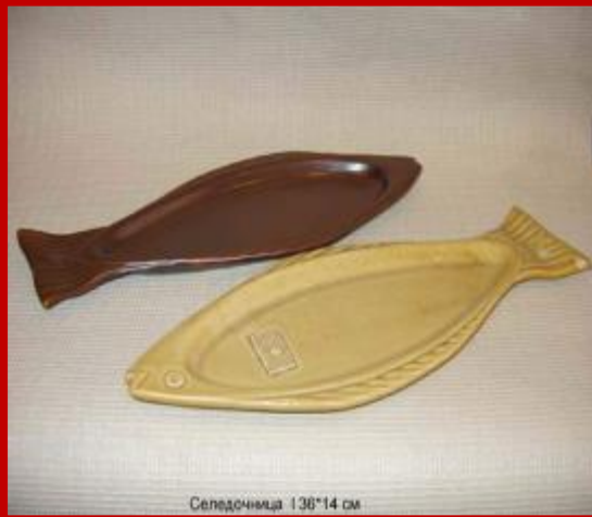
Селёдочка 138*14 см