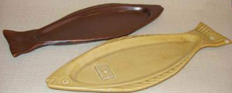
Селедочница 136*14 см