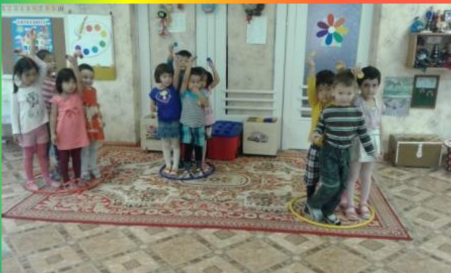
«Найди свой цвет»