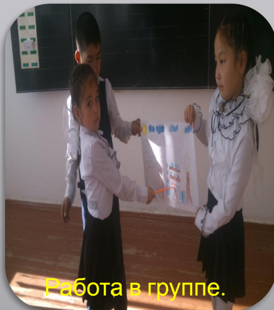
Работа в группе.

Осенью деревья дарят елочке подарки. Осина дарит красные китайские фонарики. Клен роняет оранжевые звезды. Ива засыпает елочку золотыми рыбками. И стоит елочка нарядная. Раскинула ветки, а на ладожках подарки.