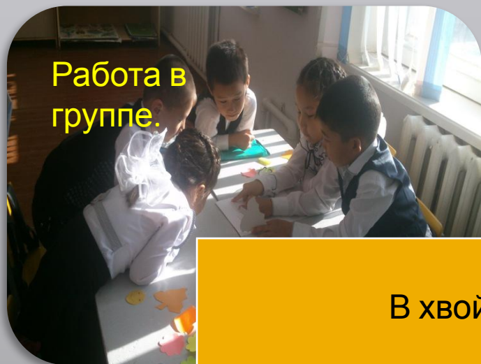
Работа в группе.

В хвойном лесу выросла красавица-елка. Ель была очень высокая, стройная, как свеча. Ее темно-коричневый ствол был покрыт толстой, шершавой корой. Далеко в стороны раскинула она свои тяжелые, мохнатые ветки. Каждая ветка покрыта тонкими, колючими иголками.