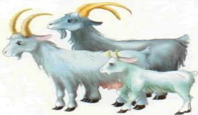
Коза — козёл — козлёнок