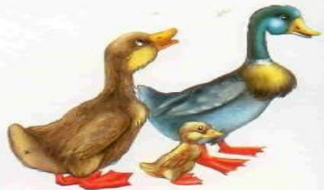
Утка — селезень — утёнок