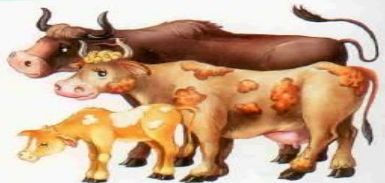
Корова — бык — телёнок