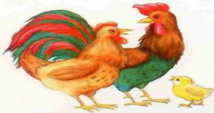
Курица — петух — цыплёнок