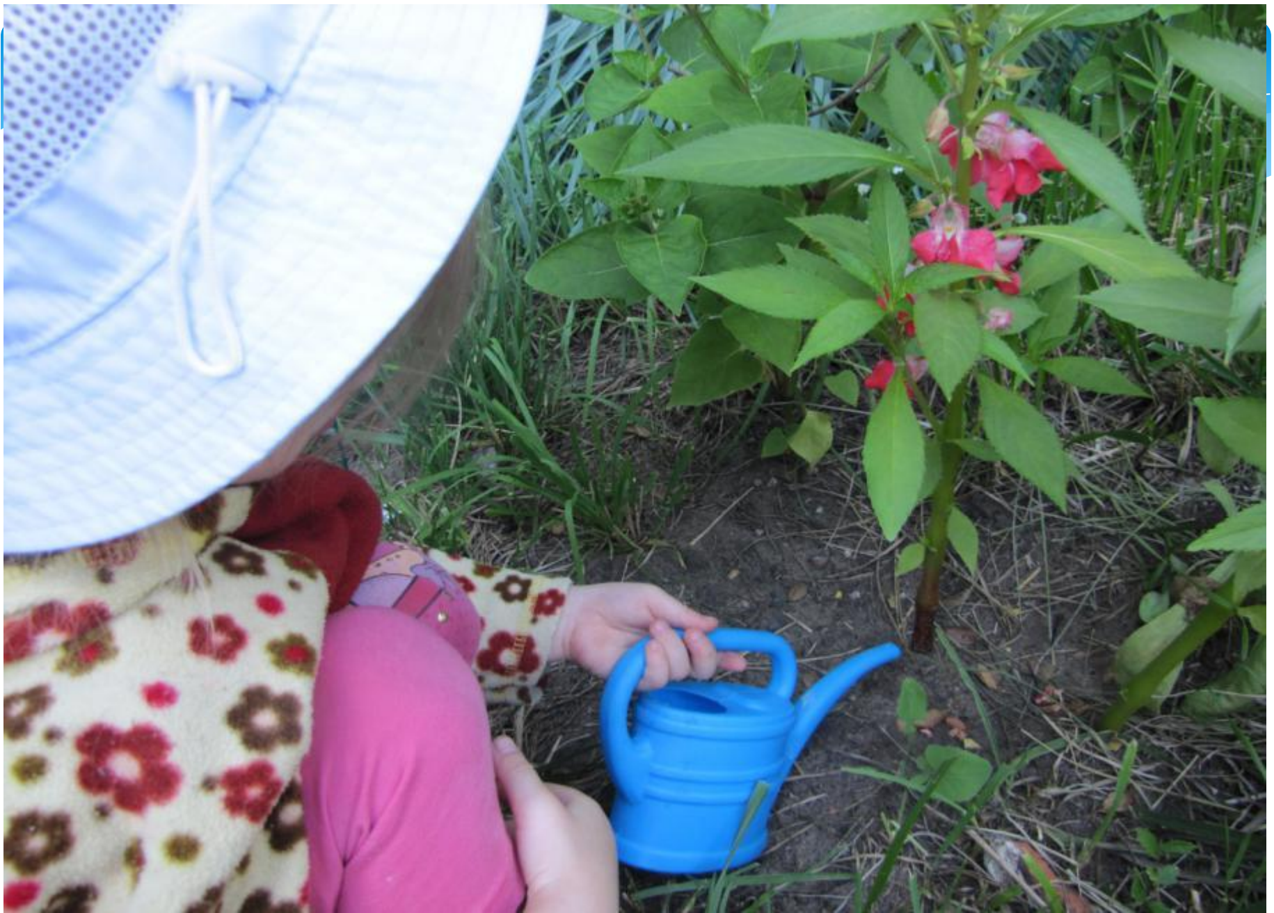
Полив « Бальзамина», который размножается семенами