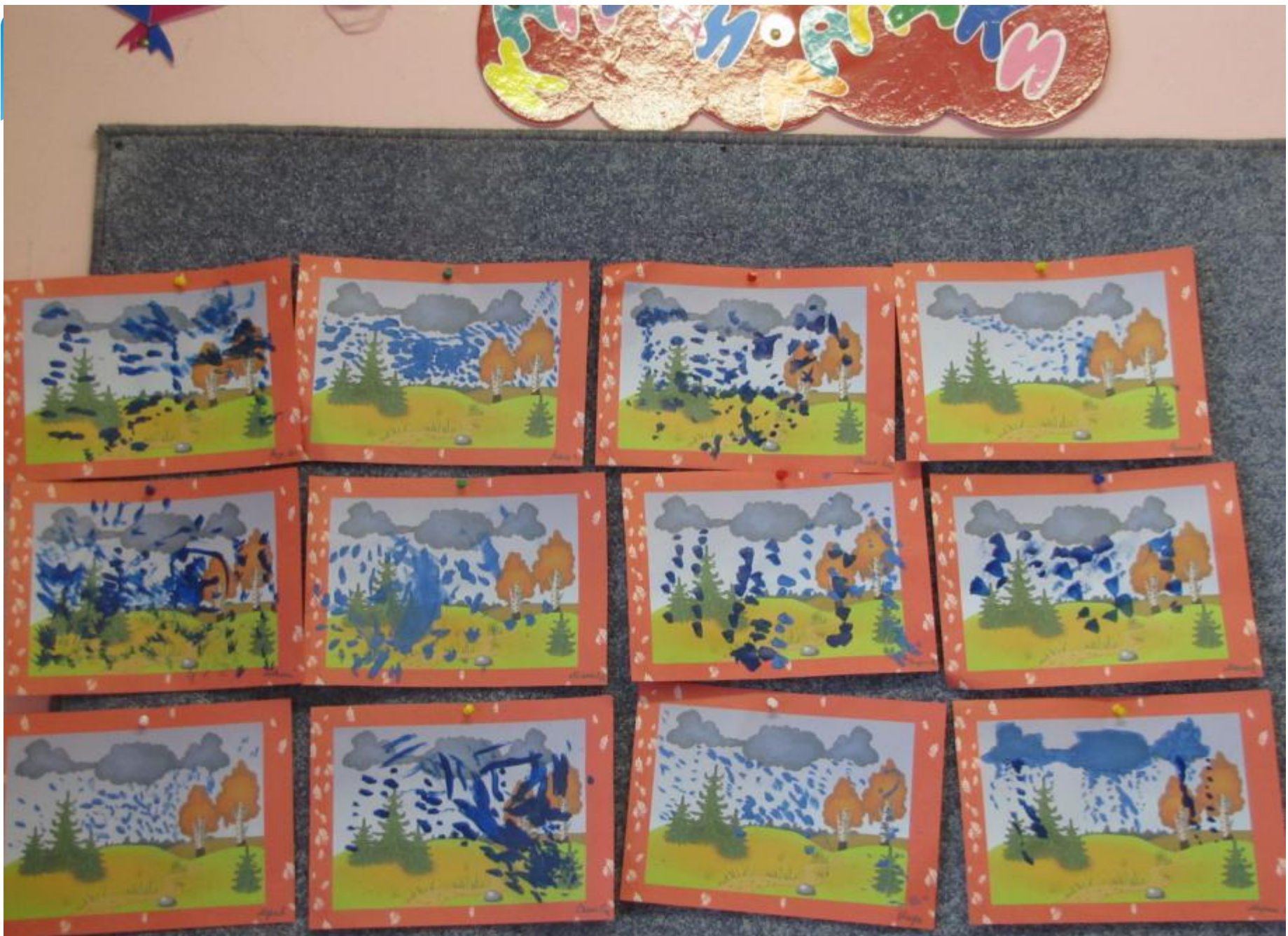
Изобразительная деятельность на тему « Дождик»