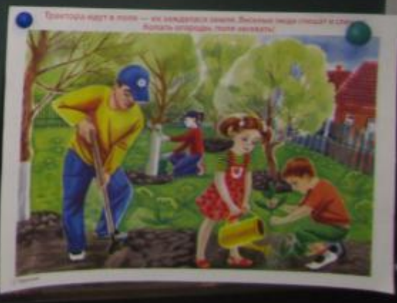
Наглядный материал на тему «Окружающий мир и вода»