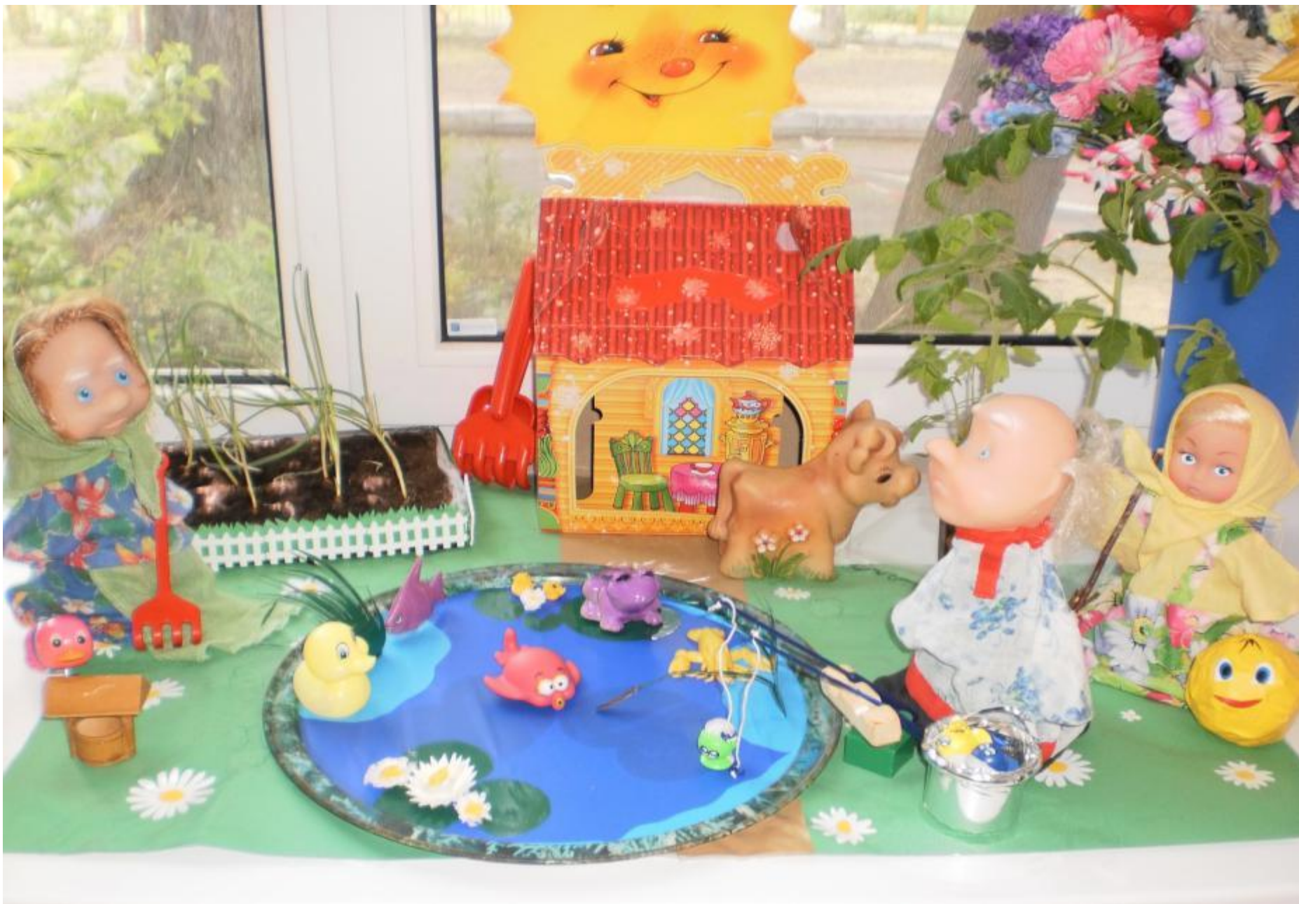
Огород на окне « У озера»