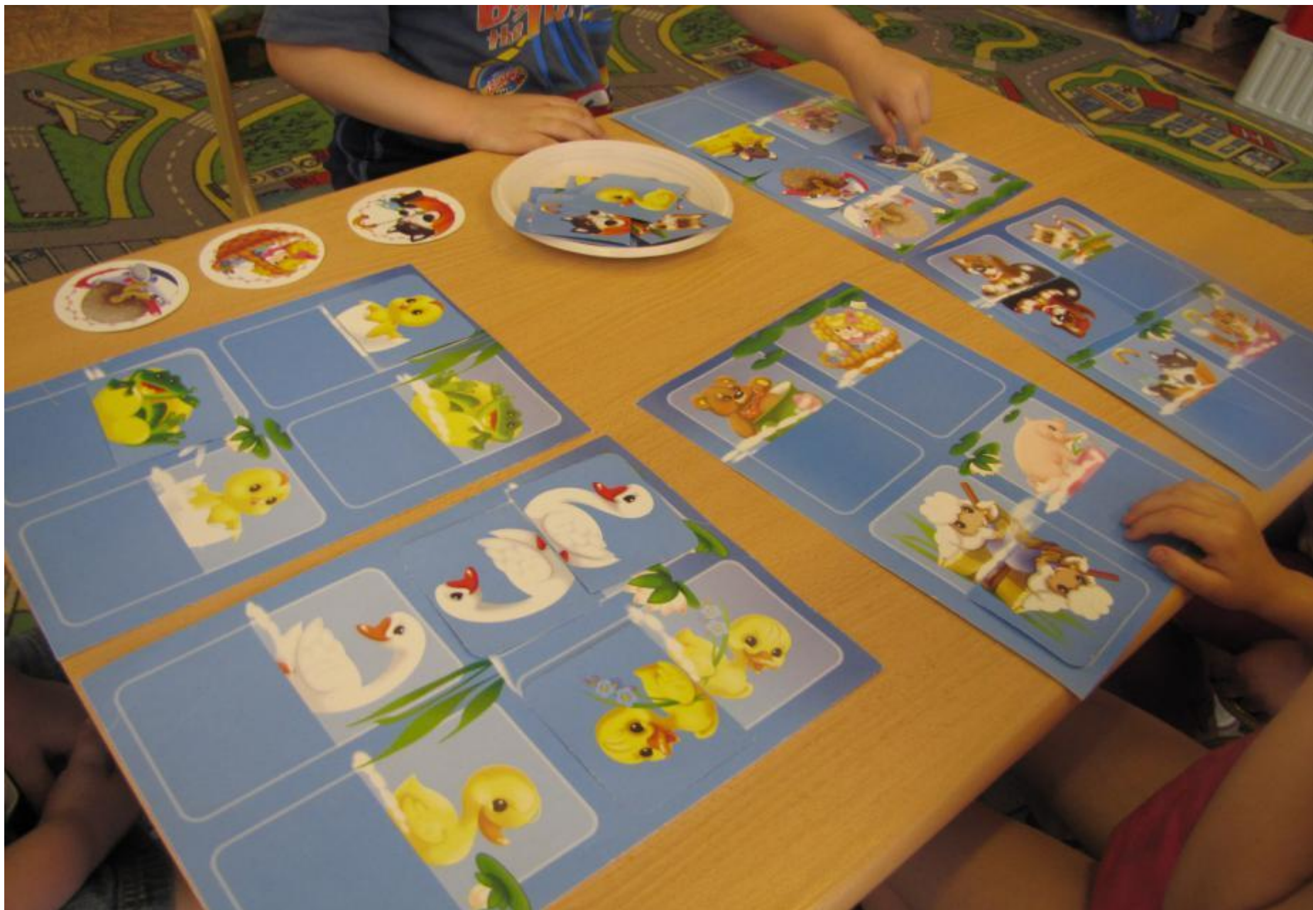
Дидактическая игра « Кто плавает»