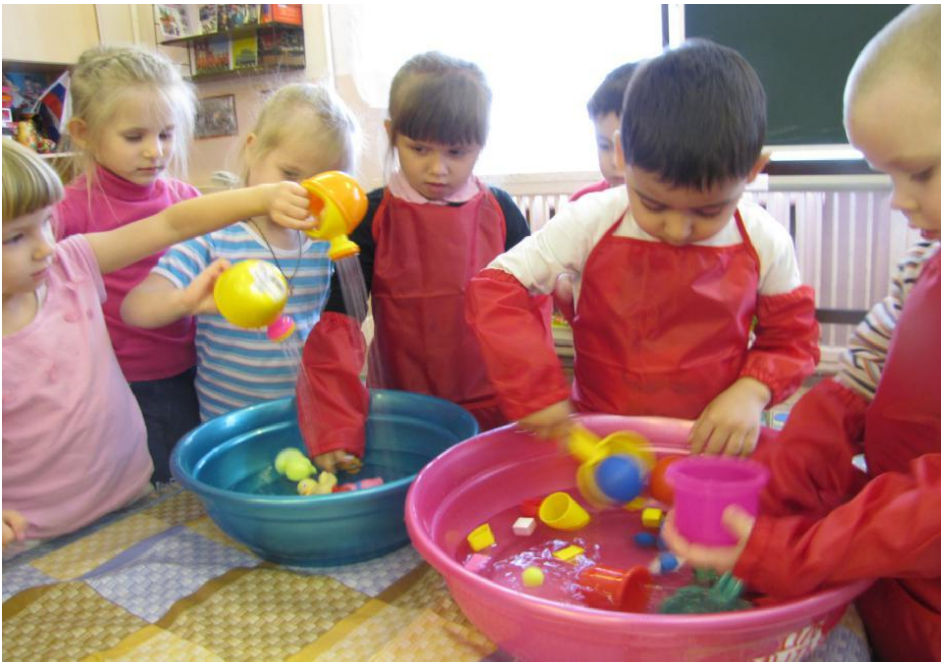
ИГРЫ С ЛЕЙКАМИ