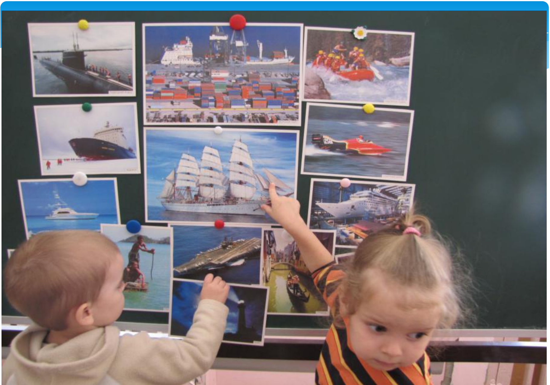
Рассматривание иллюстраций « Морской транспорт»