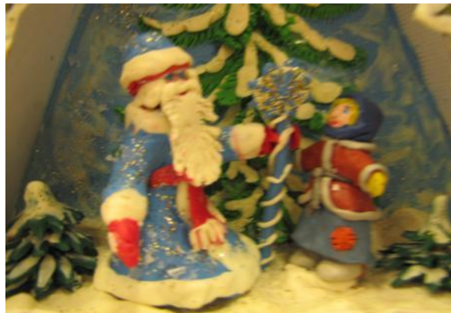
Совместная деятельность воспитателей, родителей и детей «Пластилиновые сказки и вода»