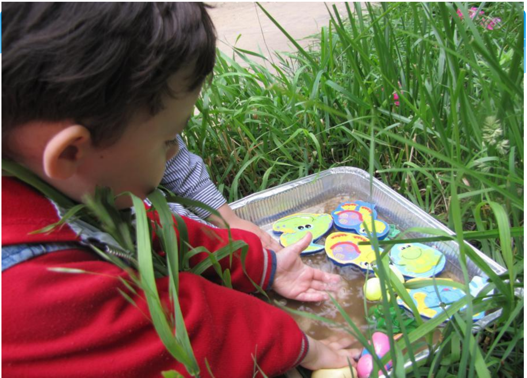
Закаливающие игры на воздухе с водой