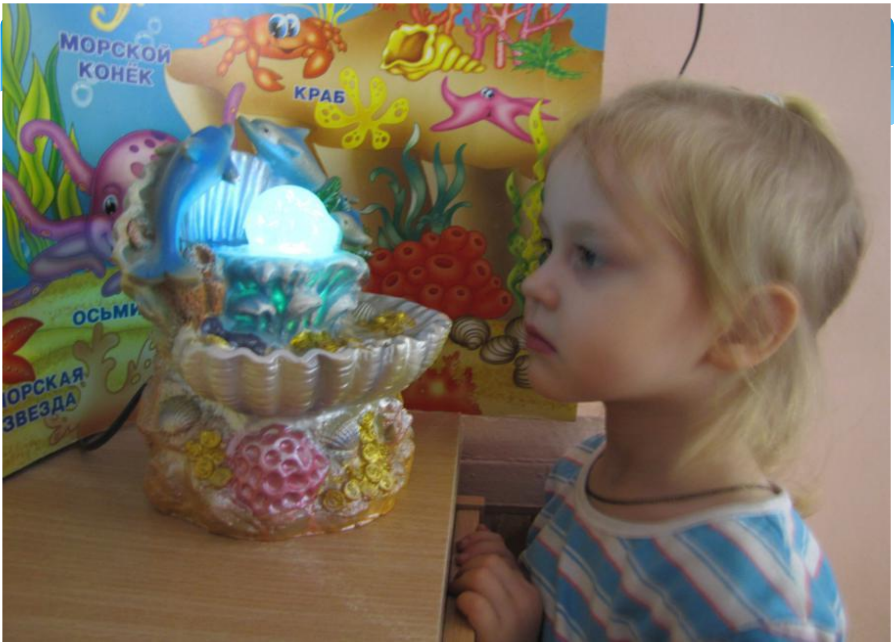
Наблюдение за фонтаном. Релаксация.