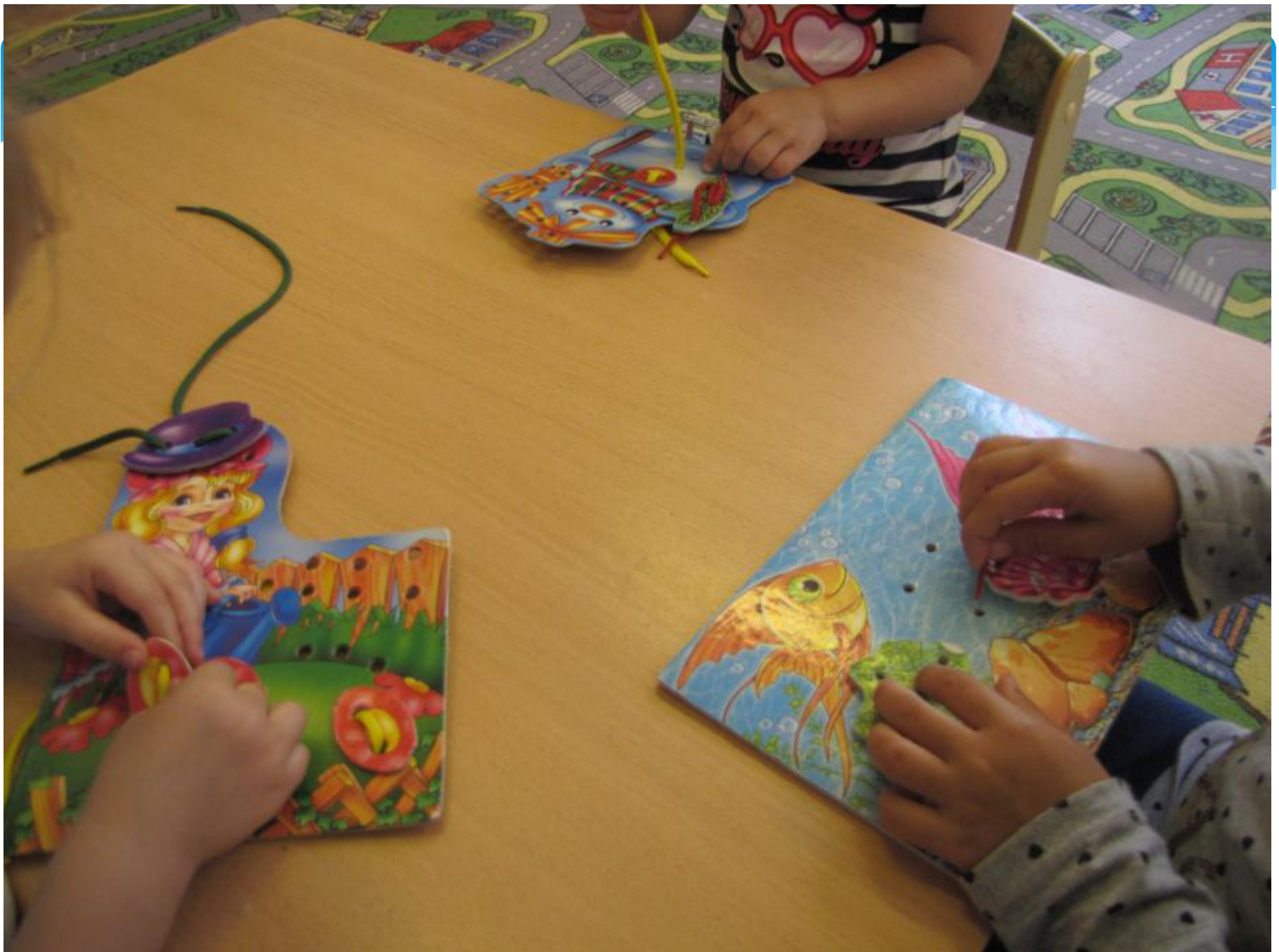
Игры со шнуровками ; «Аквариум», «Полей огород», «Снеговик».