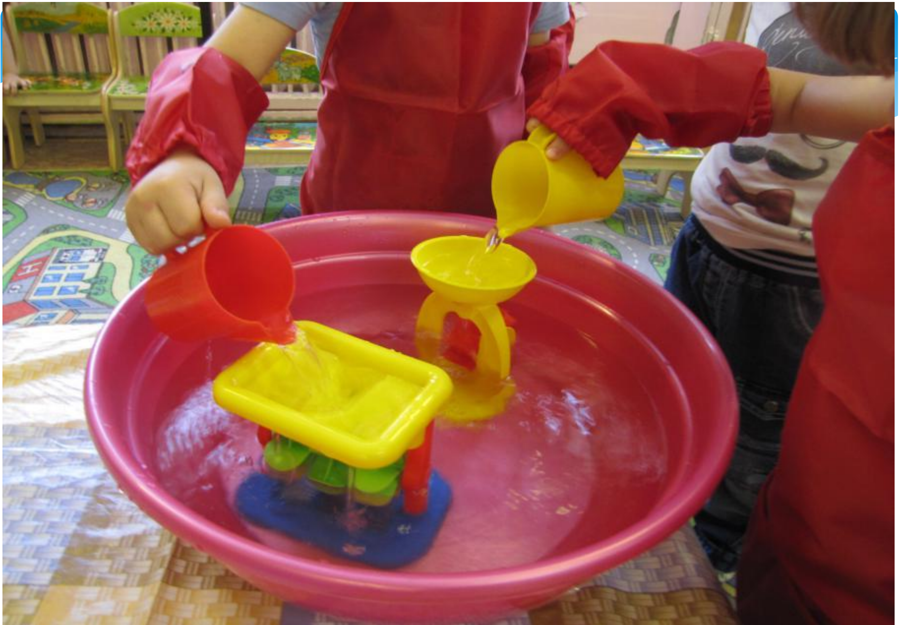
Игры с мельницами