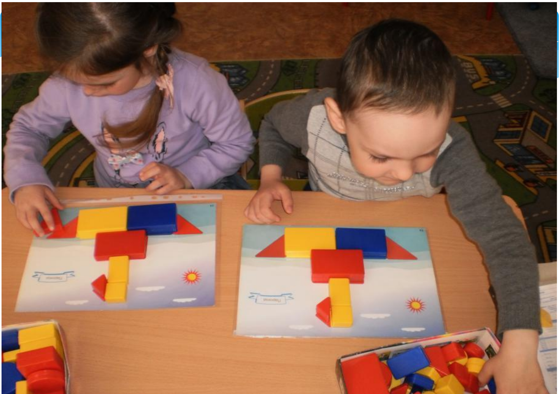
Игры с блоками Дьенеша