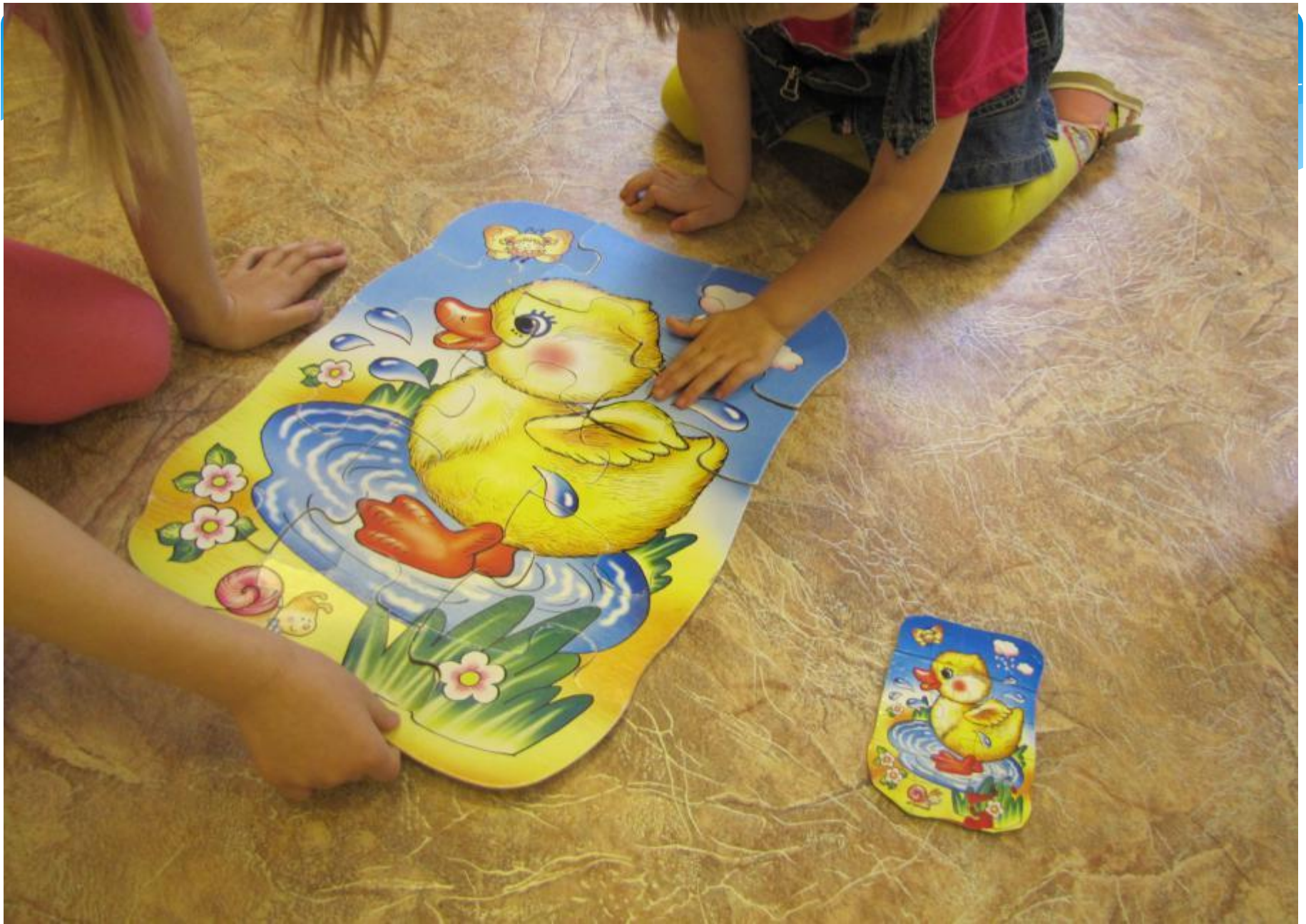
Дидактическая игра «Составь картинку». Работа с пазлами.