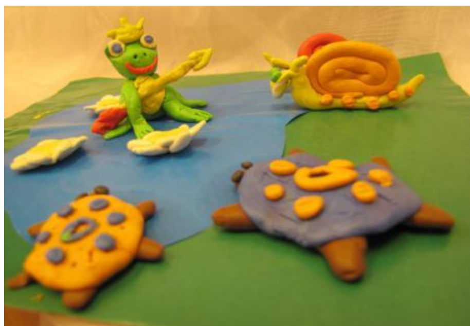
Совместная деятельность воспитателей, родителей и детей «Пластилиновые сказки и вода»