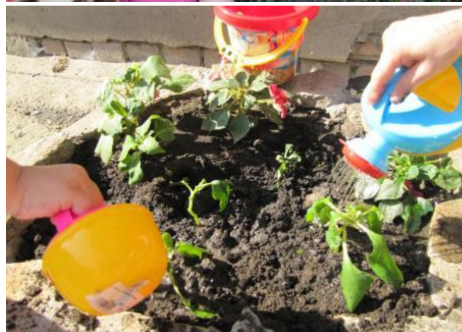
Труд в природе