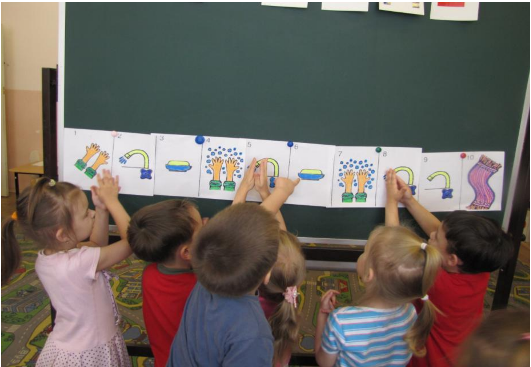
Схема последовательности мытья рук