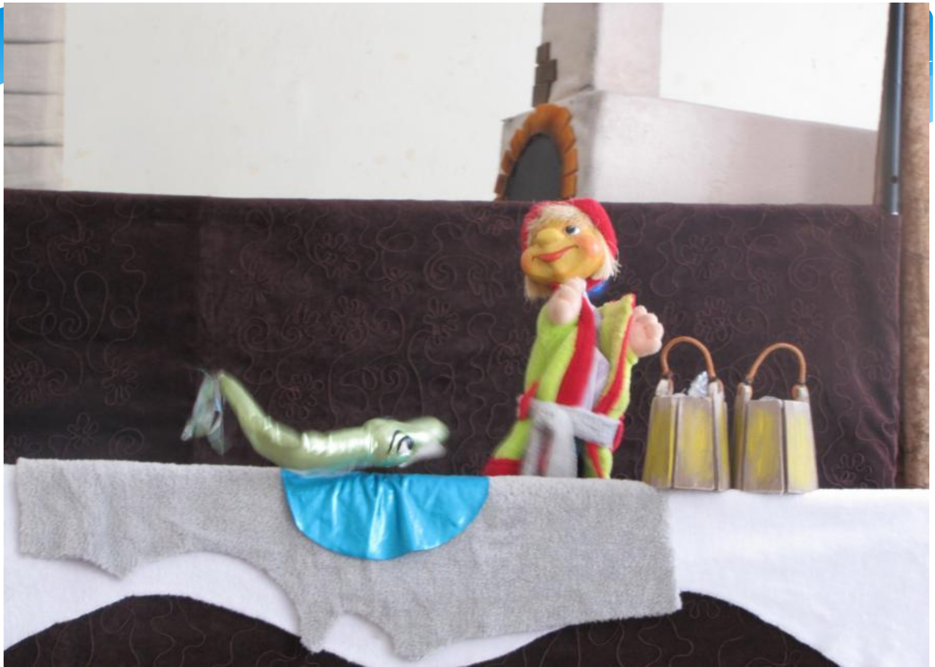
Кукольный спектакль «По щучьему велению»