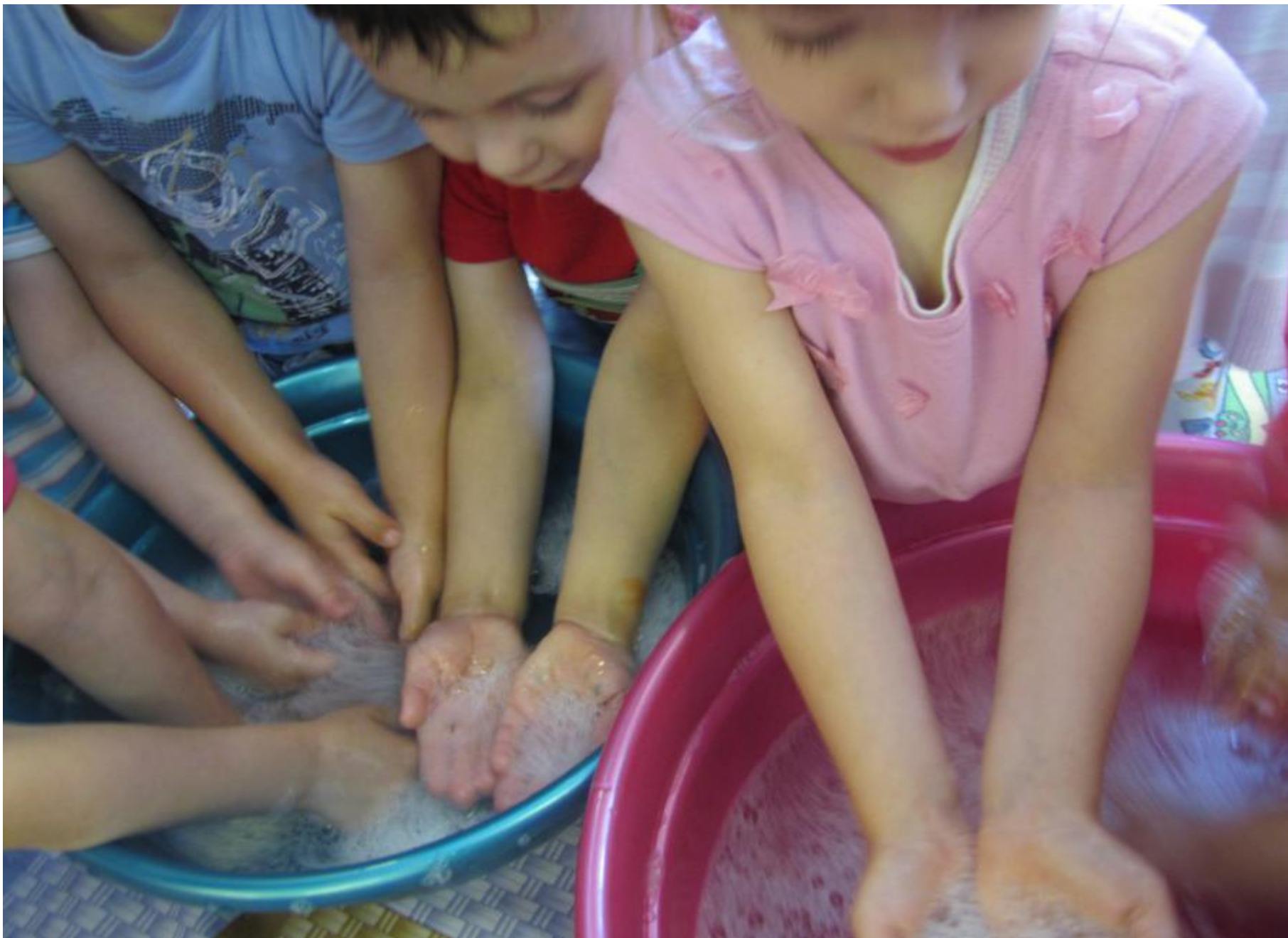
Игры с мыльной пенкой