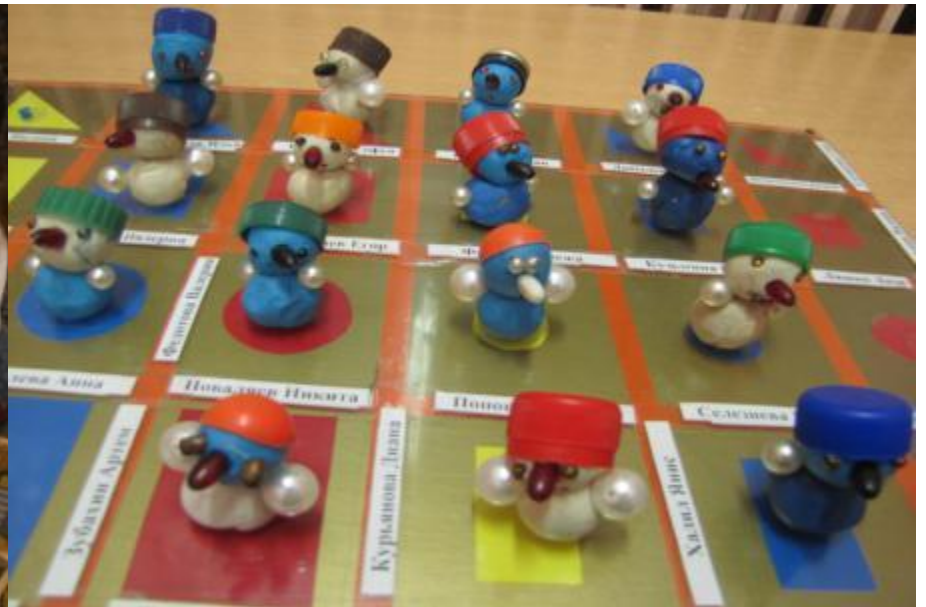
Лепка на темы: «Лодочка», «Кто плавает по реке?», «Снеговик»