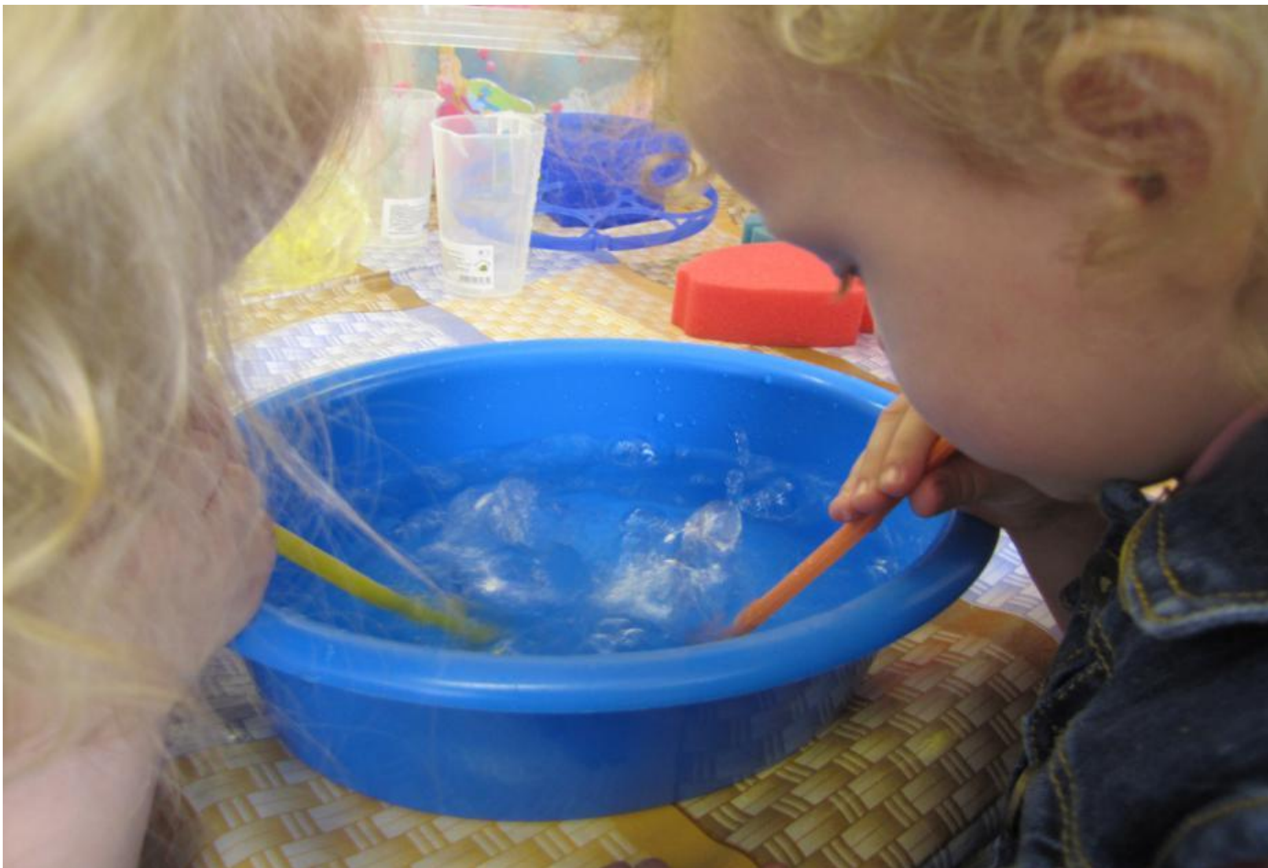
ИГРЫ С СОЛОМКАМИ