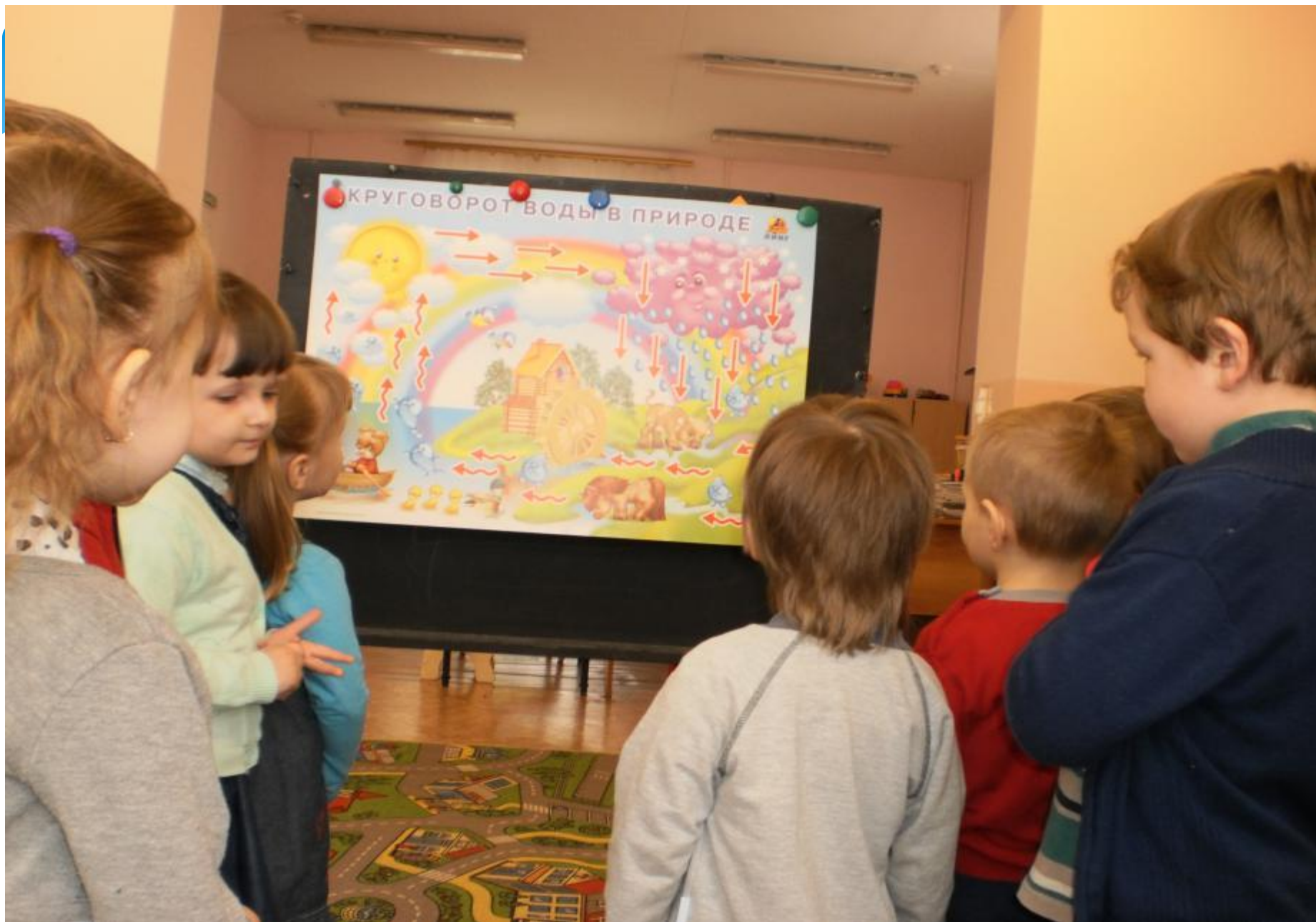
Беседа на тему «Круговорот воды в природе»