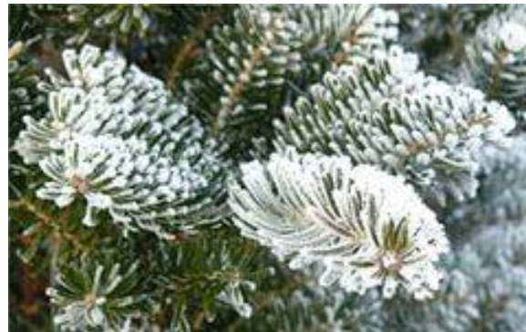
Иней-тонкий слой ледяных кристаллов образующихся из водяного пара атмосферы