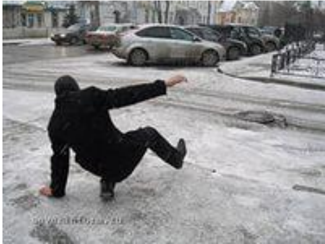
Гололёд- слой плотного стекловидного льда