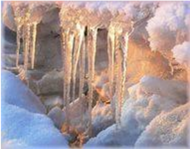
Оттепель-временное таяние снега зимой, ранней весной