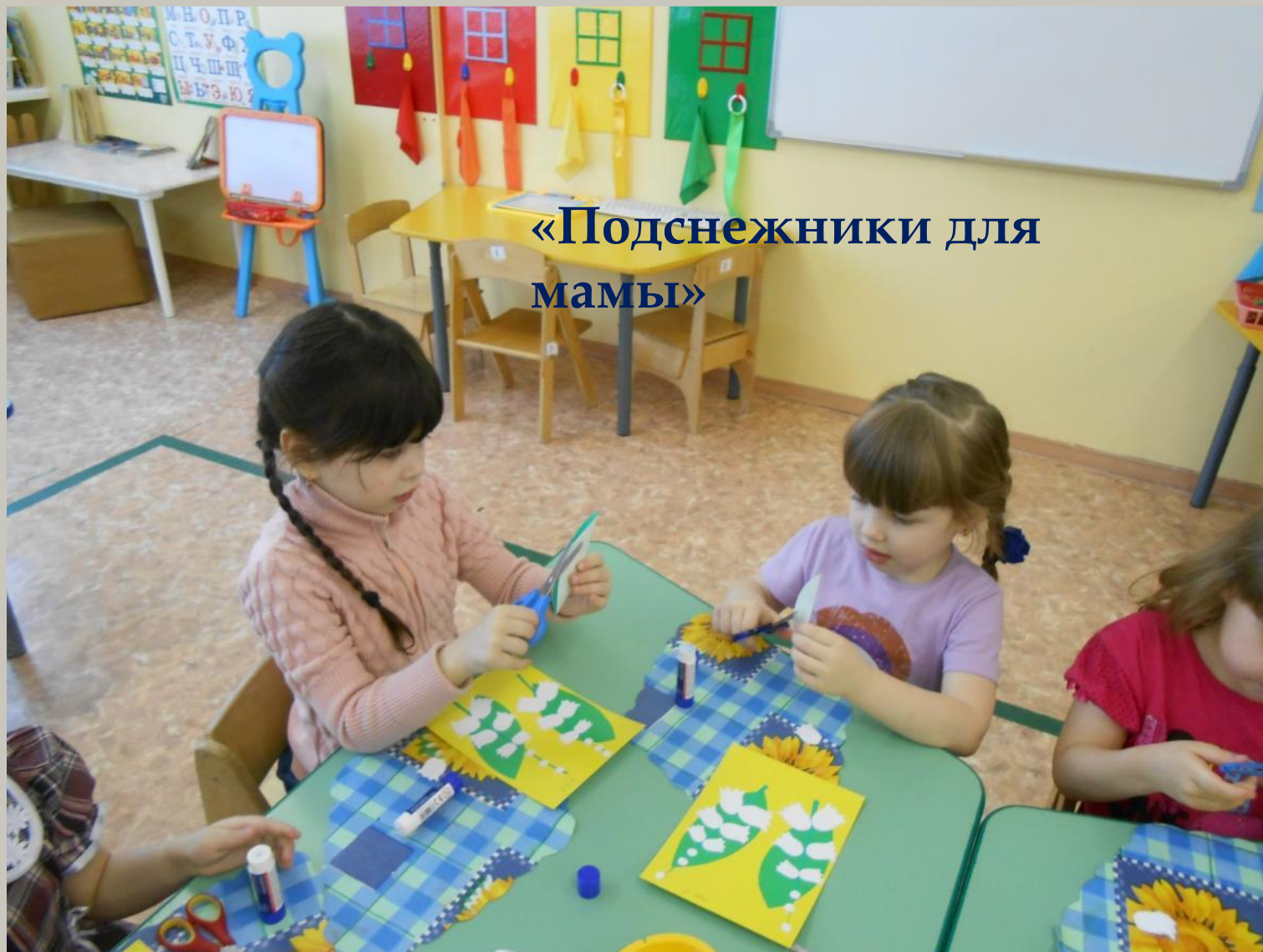
«Подснежники для мамы»